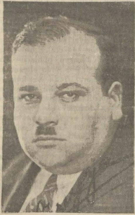
eni teşekkül eden mintakanın reisi

Maksadımız aradaki ihtilâfı yine dost olarak dinlemektir