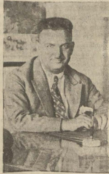
Eski mintakanın reisi