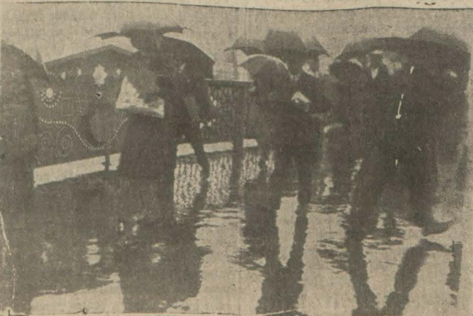
[ Yazısı 5 inci sayfamızda ]