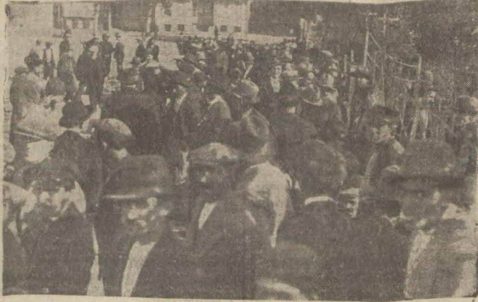
Fatih'te belediye dairesi önünde reyini vermek için toplanan halk

Yahya Galip B. in mazisi sade bir tekke şeyhliğine hiçe indirilemez. Yahya Galip B. milli mücadelede Ankara defterdarı, sonra valisi olarak milli istihlâs hareketine hizmet etmiş bir zatır. Ve bir tekke şeyhi değil, hakiki bir inkılâpçı olduğunu istihlâstan sonraki hareketleriyle göstermiştir. Bu cihetle yaptığı hizmetin kıymeti bizzat Gazi Hz. tarafın-