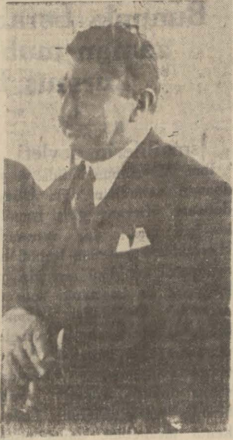
Turing kulüpleri kongresini açacak olan Şükrü Kaya B.

devam edecek ve öğle yemeği Serik Doryanda yenecektir. Öğleden sonra Boğaziçi ve Bentlerde bir gezinti yapılacak, Tarabyada Tokatlıyanda bir suvare verilecek ve avdet edilecektir.