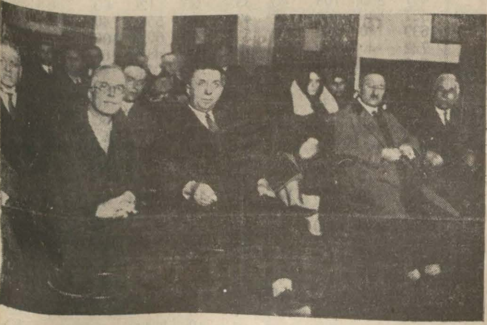
Gayri mübadillerden bir grup

Alâkadarların muhtelif iddialara karşı verdikleri cevap