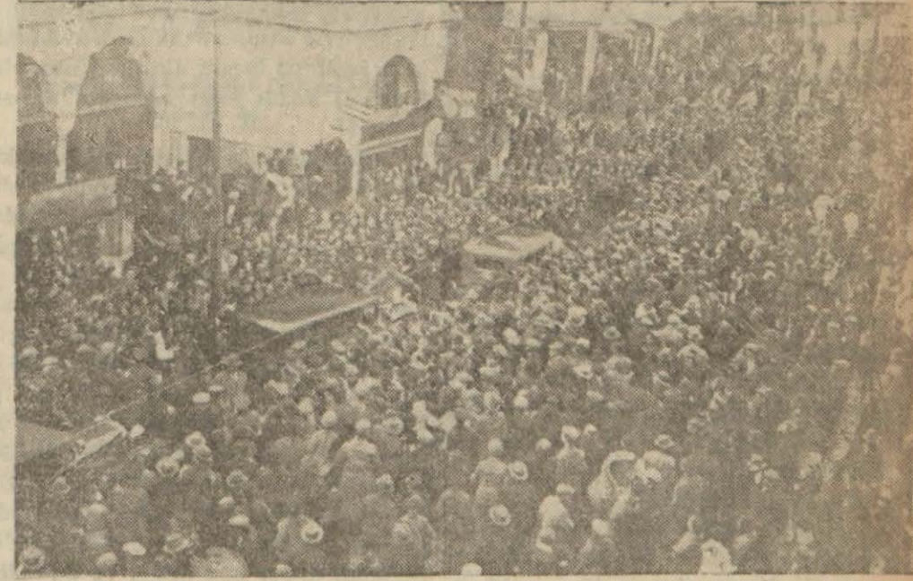
Gazi Hz. ayakkabıcılar cemiyetinin Çarşıkapıdaki merkezinden ayrılırken cadde kalabalığından geçilmez bir hâl almıştı