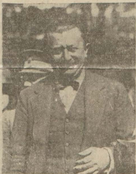
Dahiliye Vekili Şükrü Kaya B.