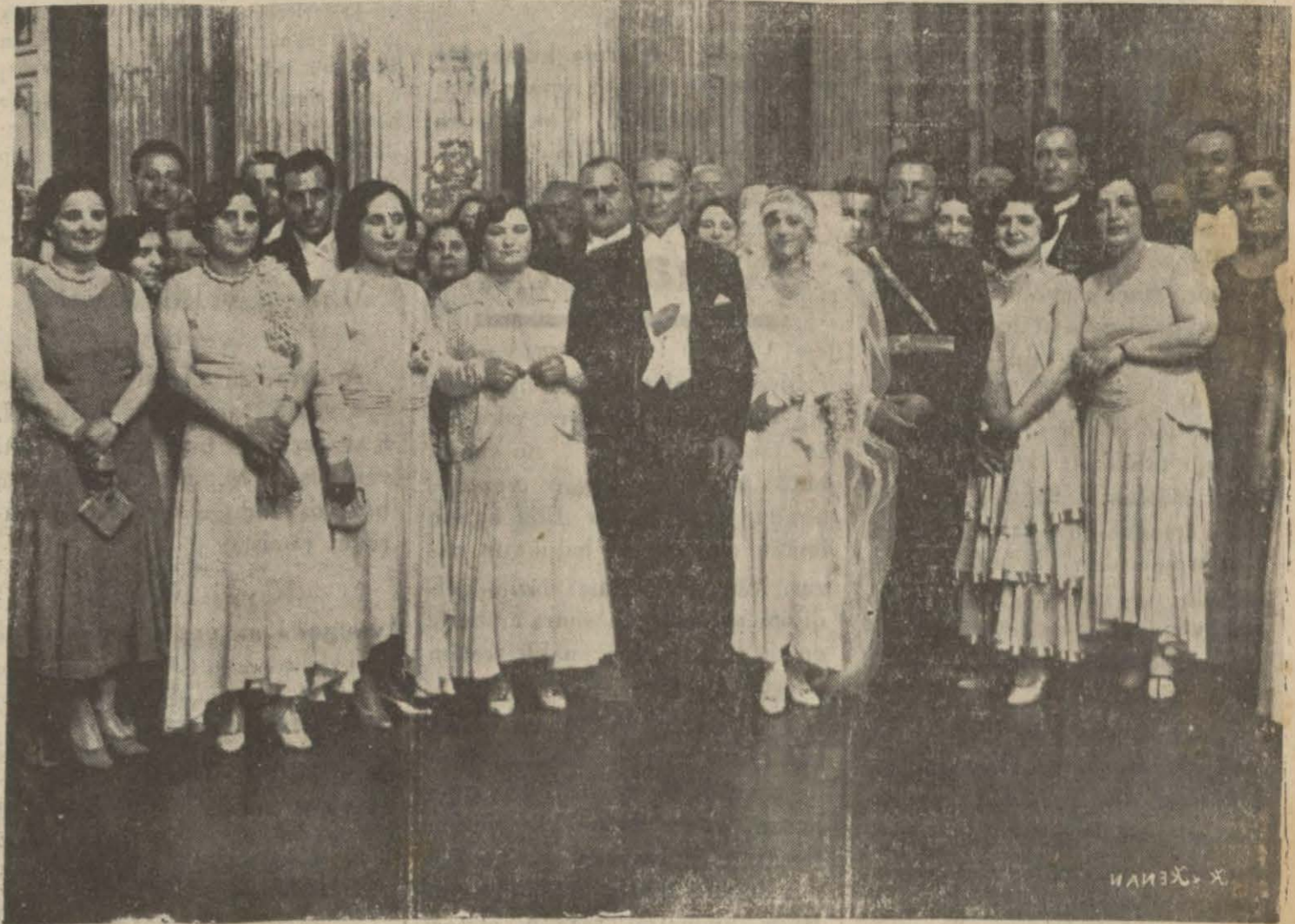
Gazi Hz. lerî davetileri arasında

Gazi Hz. lerinin manevî kerimeleri Rukiye Hf.nin düğünleri tes'it edildi