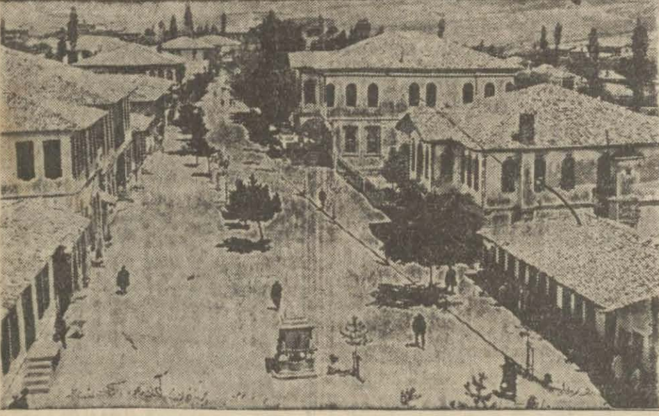
Yozgat hükümet caddesi