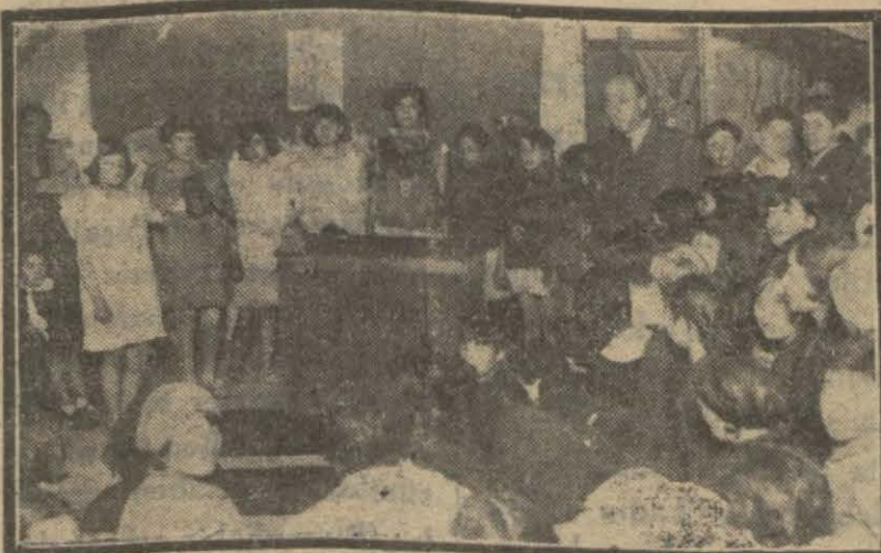
Beşinci ilköğretim mekteplerinde müsamereden bir intiba

Şehrimizde tesis olunan 800 e yakın millet dersanesinin çoğunun tezahurat ile yapılan açılma ve ilk derse başlama merasiminden dün bahsetmiştik.