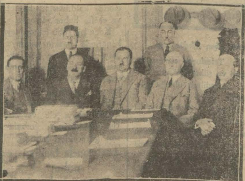
Sanayi birliğinde toplanan trikotajcılar

Sanayii teşvik kanununun 9uncu mad- desini ileri sürüyorlar Dün sanayi birliğinde bir içtima yapıldı