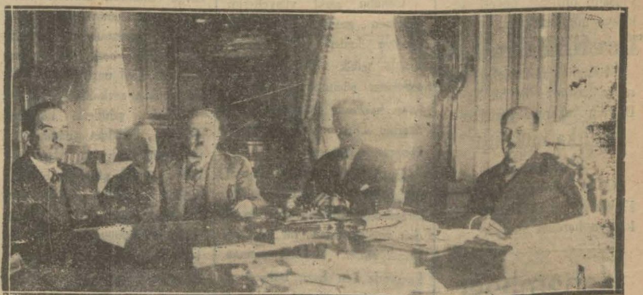
Millet mektepleri İstanbul vilâyeti komisyonu içtima halinde

Bir teşrinsanide bütün memlekette olduğu gibi şehrimizde de açılacak olan millet mektepleri iş- lerile meşgul olacakleri iş- yon dün vilâyette ilk içti- maini yapmıştır.