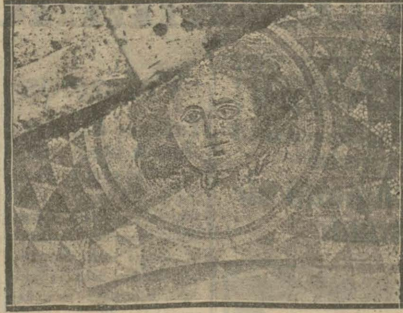
Avukat Fehmi Beyin bahçesinden çıkan Medüz başı

Bergamadan yazıyor: Geçen sene şehrimizde avukat Fehmi Beyin evinin bahçesinde inşaat yapılırken kazılan yerlerde bazı mozaiklere tesadüf edilmiştir. Asarı atika umumî müfettiş Aziz Bey dün şehrimize gelmiş, Fehmi Beyin evinin bahçesinde bir sondaj ameliyesi yapmıştır.