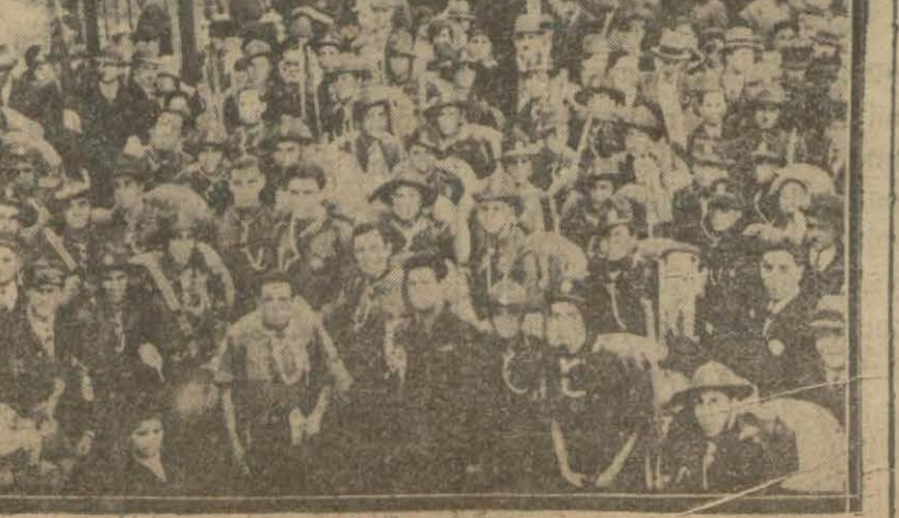
Dün Ankaraya giden izcilerimizden bir grup

Bundan sonra merasimde hazır bulunanlara limonata da-