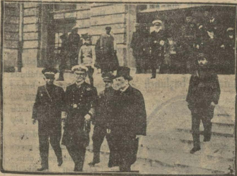
Misafirlerimiz dün Haydarpaşa İstasyonunda