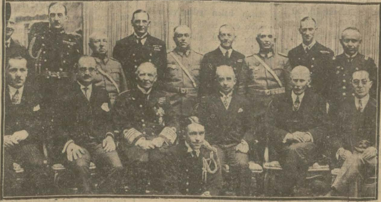
Ankarada İngiliz sefiri tarafından verilen ziyafette heyeti vekile azaları ve misafirler