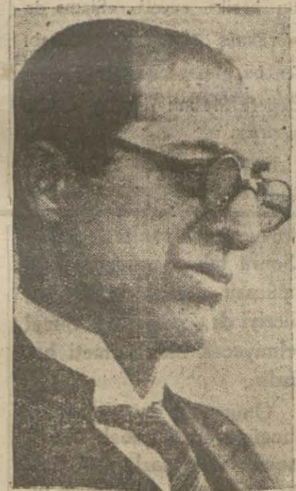
Tevfik Rüşti B.

Aldığımız malumata göre Hariciye vekili Tevfik Rüşti bey pek yakında şehrimize gelecektir.