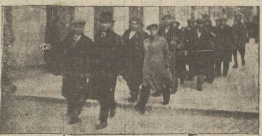
Komünistlik maznunları adliyyeye sevk edilirken

Komünistlik etrafında bazı hareketlerinden dolayı haklarında tahkikat yapılanların dün adliyyeye teslim olunduklarını ve tahkikatın dördüncü istintak dairesine intikal ettiğini yazmıştık.