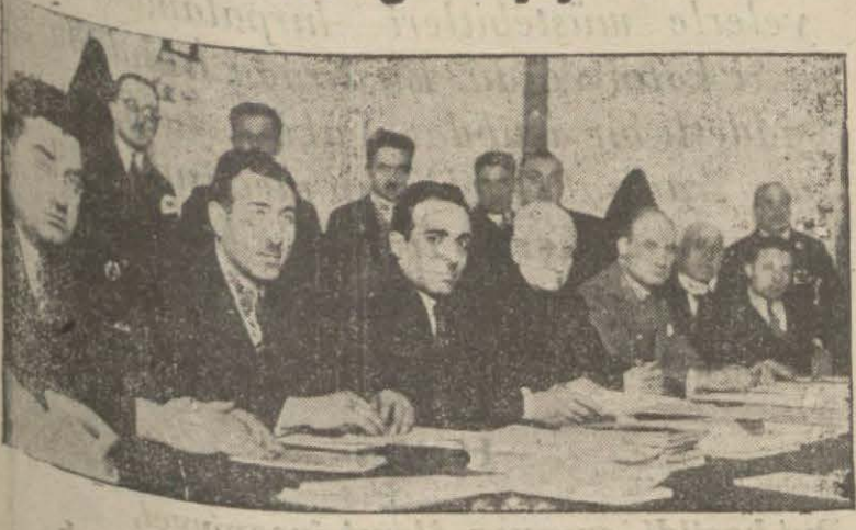
Sanayi Birliğinde dünkü içtima

Yerli malların teşhiri için bir sergi açılmak üzere dün sanayi birliğinde saat 16 da bir içtima yapılarak müzakeratta bulunmuştur. Sanayi birliği serginin fırka binasında açılması için teşebbüste bulunmuş, bu talep kabul edilmiştir. Fırkada açılacak olan sergide bilünüm yerli emtia, dokumalar, kumaşlar, çoraplar, bastonlar, kadınlara mahsus ipekli, mendil ve daha birçok eşya teşhir edilecektir. Serginin açılması için lazımgelen masarifi ticaret odası açılması için hazırlıklara harekete devam edilmektedir. Sergi 22 haziranda açılacaktır.