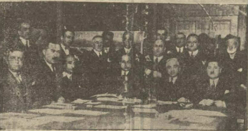
Liman şirketinde dünkü içtimadan bir intiba

Liman şirketi heyeti umumiyesi dün Liman hanındaki şirket binasında fevkalâde bir içtima aktetmiştir. Ruzname İktisat vekâleti tarafından teklif edilen mevat, dalgalığın inhisar harici bırakılması temettütün mevlurlarla idare edilmiş azaklara tevzi şeklinde tadilat yapılması hususlarından ibaret bulunmakta idi. Dün, bu müzakerat yapılmış ve tekliflerin bir defa da salâhiyetler encümen tarafından teklif edilmesi için içtima talik olunmuştur.