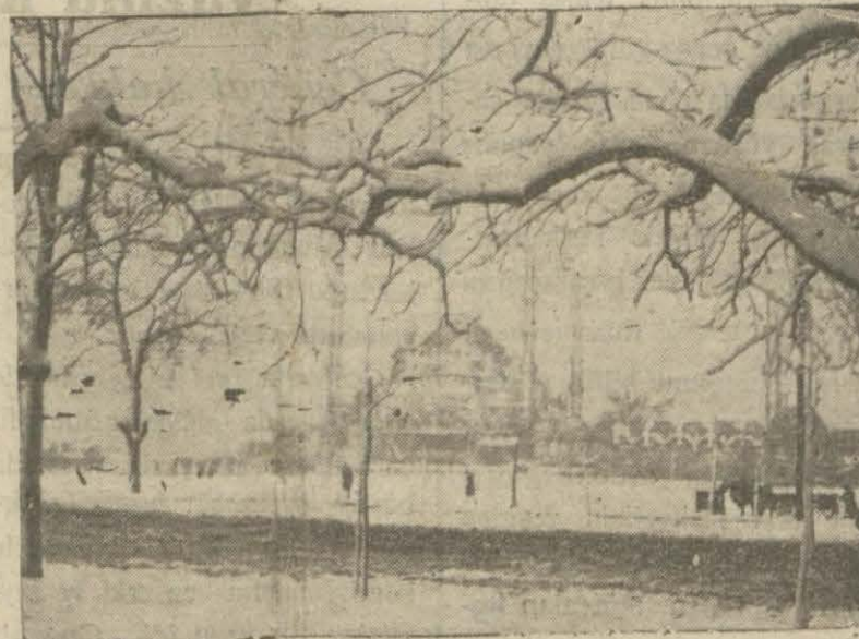
Sullânshmet meydanının dânkâ manzarası