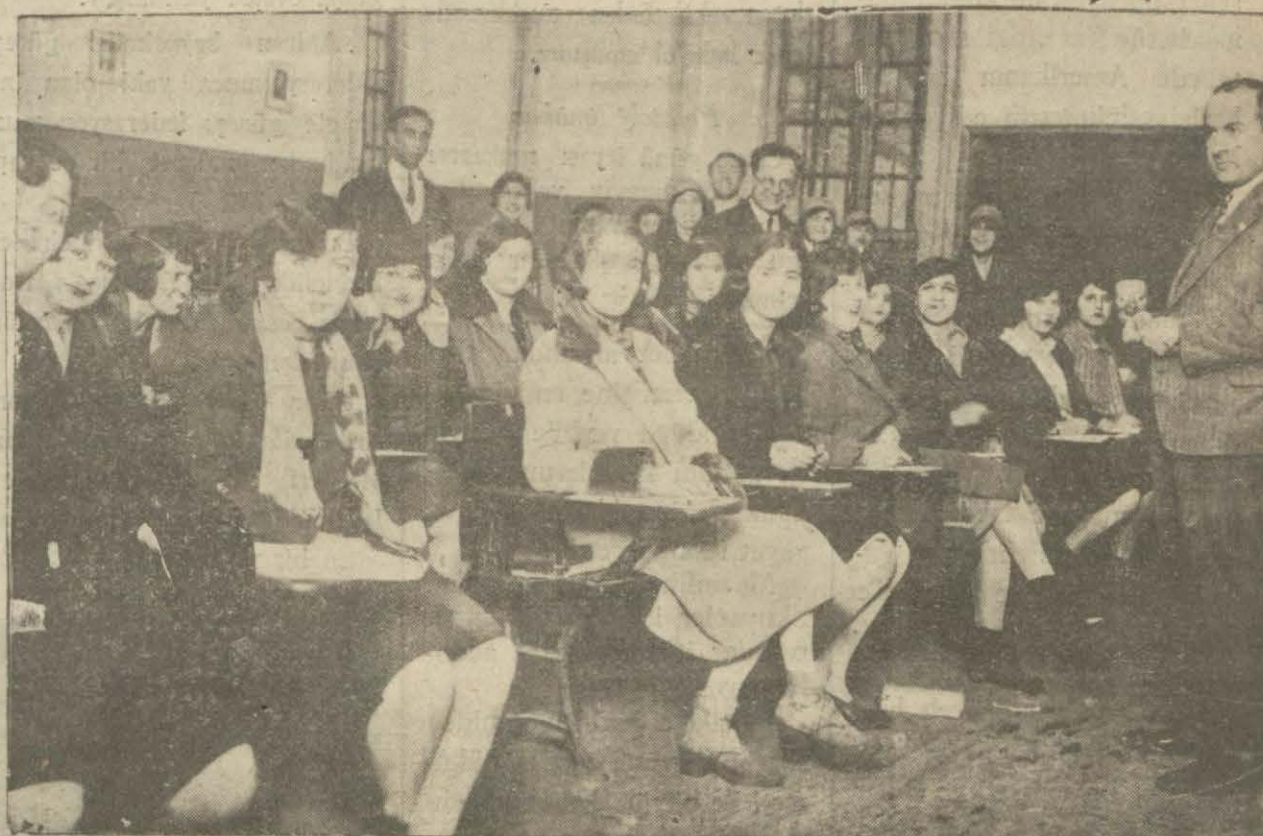
Galatasaraydaki kursta imtihan yapılırken

Millet mekteplerinin (B) kurslarında dünden itibaren imtihan faaliyetine başlanılmıştır. Bu kurslardan iki aylık ders müddetini bitirenlerin müdâvimleri dün gece ders saatinde imtihan edilmişlerdir.