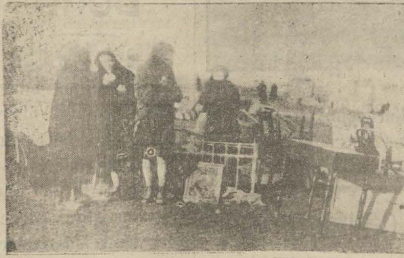
Dünkü Bakırköy yangınından iki intiba : Melcesiz kalan aileler ve ateş içinde çalışan etfaiye neferleri

Şu ciheti de tavzihâ lüzum görürüz ki mütabassis olan doktorlar da nihayet birer insandır; bunlar da göz ile görülemeyen, fennî alât ve yesait ile hissedilemeyen dahil bazı hastalıkların teşhisinde yanılabilirler; bu yol-