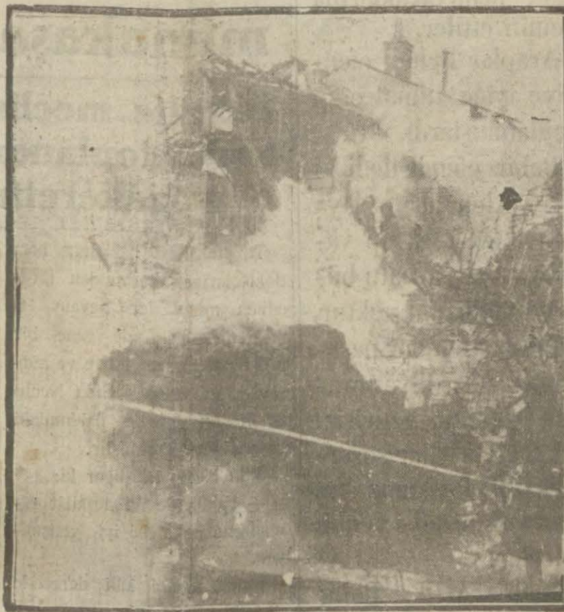
Bakırköy yangınından tüylerüperçici bir manzara