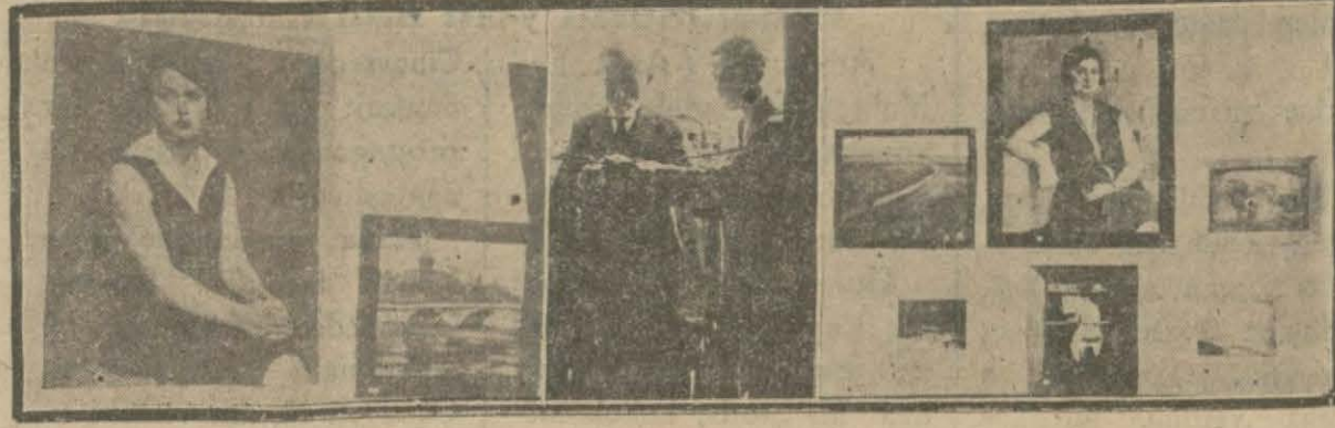
Genç ressamın sergisinin kışadına ve eserlere ait intibalar