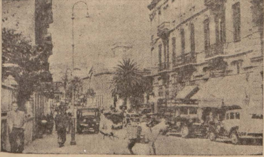
Madrid'den bir görünüş

Almanyanın, açıktan açığa İspanyaya yardım etmesi, Pariste heyecan uyandırdı