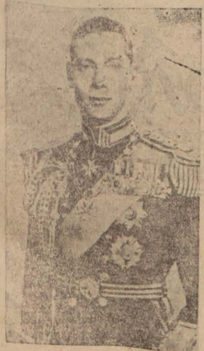
Kral altıncı Jorj

Londra, 5 (Radyo) — İngiltere kralı Sa Majeste altıncı Jorjun taç giyme merasimi için başlayan hazırlıklar devam ediyor. Merasimin, Vest Minster sarayında olması takarrür eylemiştir.