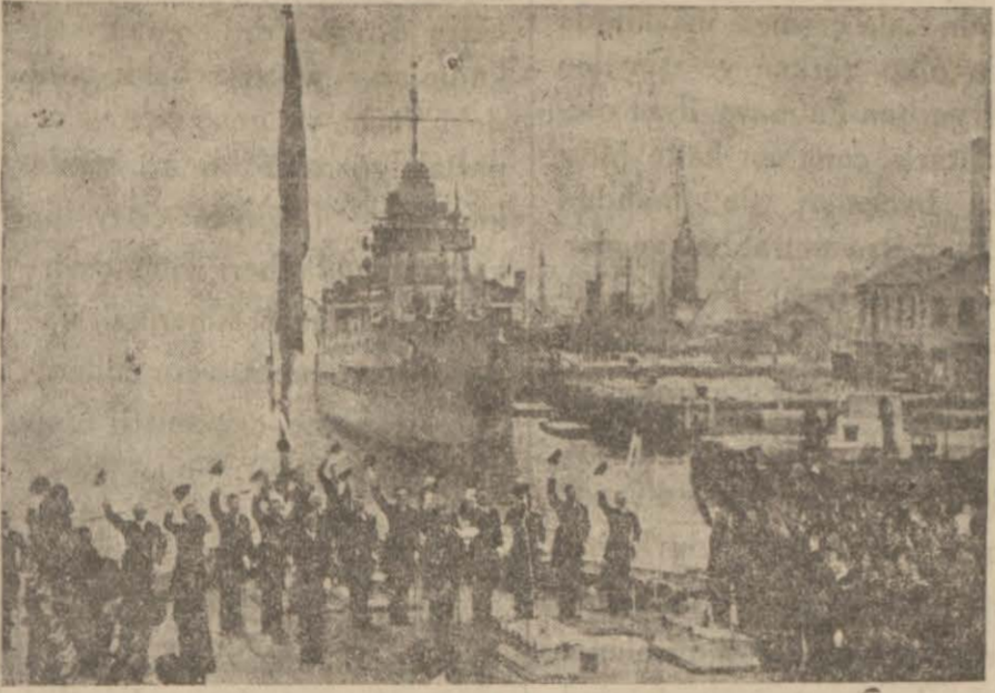
İngiliz donanması selâmlanırken

Bir İngiliz Destroyerine de 6 bomba atıldı. İngiliz filosu manevralardan vaz geçti.