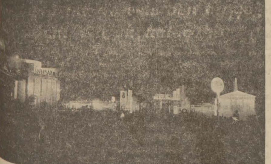
Fuarın gece görünüşü Yedinci Enternasyonal İzmir fuarı, bugün gece yarısından sonra saat 2 de kapanacaktır. — Devamı 4 ncü sahifede —

Belediye reisi, ekspozanlara verilecek ziyafette kapanış nutkunu iradedecek.