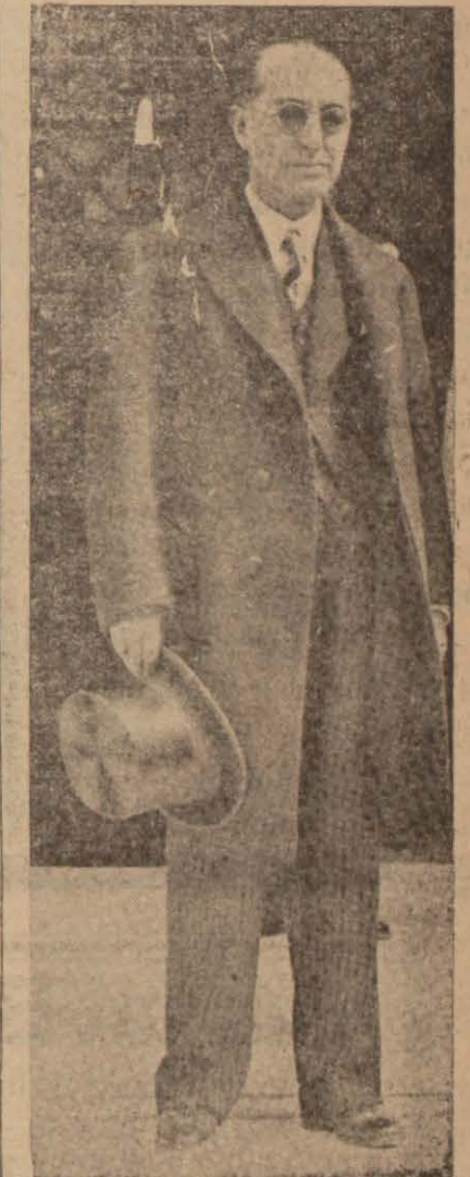
Tefvik Rüştü Aras

Gazetemizi okumakla onun yaşamasını temin eden sevgili okurlarımıza bu vesile ile tekrar tekrar teşekkür etmeği bir borç biliriz.