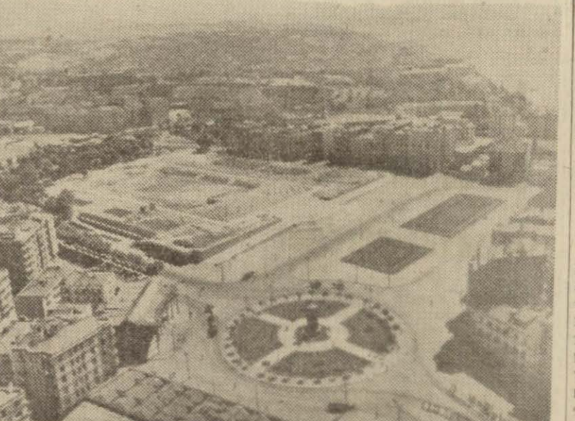
Taksim'de İnönü gezisinin havadan görünüşü

Mecmuanın her cildi, en aktüel meselelerin ilim zaviyesinden tetkikine hasredilmiş yazılarda doludur. Bunlardan başka gerek Türkçe, gerek yabancı dillerde siyasi ilimlere dair nesredilmiş olan eserlerin bir çoklarından bâhis bildirilmektedir.