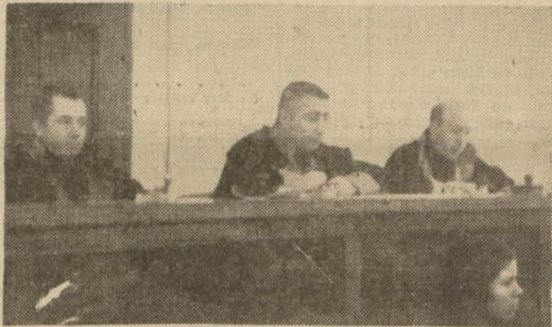
Dünkü celsede Hâkimler Heyeti

Bunlar mümkün olabilmek için elektrik şütlerden alınmak ve kilovatı bizdeki sudan daha ucuz satılmak lâzımgelir. Çünkü "Ulus" gazetesinin ikinci sayfasını okuyanlar, Türk mühendislerinin bir gün bizi beyaz kuvvet bahtıyarlığına kavuşturmak için hazırlıklarını tamamlamış oldukları müjdesi ile, şüphesiz, ferahlanmışlardır: Ankara şehri ile Ankara vilâyeti çevresindeki endüstri bölgesinin ihtiyacını karşılayabilecek Çağlayık santralının projesi tamamlanmıştır. Polatlı'nın 25 kilometre kadar batı şimalinde 26 metre yüksekliğinde bir baraj, Sakarya'dan 215 milyon metreküp su toplayacak, ve 75 milyon kilovat saatlik enerjiyi almamasını sağlayacaktır. Programın ikinci Adala santrali, Ege bölgesinin ihtiyacını karşılamak üzere, Gediz üzerinde kurulacaktır. Bundan da 80 milyon kilovat saat elektrik alınacağı hesaplanmıştır. Akdeniz suları üzerinde yapılan taretler, Katırcık çayı üzerindeki taretler, (Sonu 4 üncü sayfada)