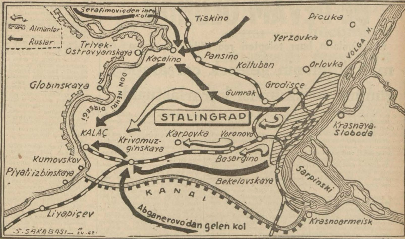
Stalingrat'taki rus çekirme hareketini gösterir harta