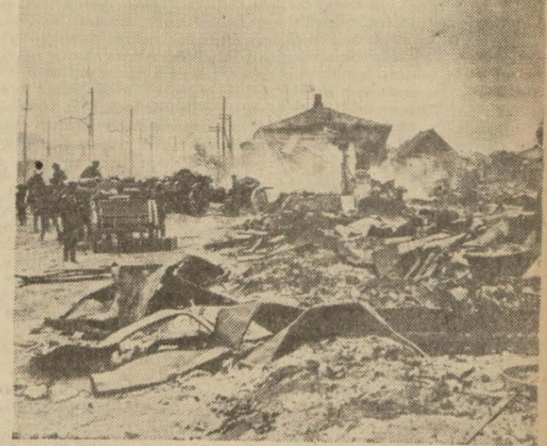
Bir enkaz yığını haline gelen Stalingrat'ta alman topçuları mevzi almağa hazırlanıyorlar

Londra, 25 a.a. — General de Gaulle tarafından bu ayın 21 inde radyoda söylenmesi mukarrer iken tehir edilmiş olan demecten bahsedilen Hariciye Nazırı M. Eden, Avam Kamarasında şu beyanatta bulunmuştur: "Simal Afrika'da general Eisenhower ile Vichy hükümetine sadık fransız devlet adamları arasında akdedilmiş olan itihafatı müzakere edecek bir zamanda bulunmuyoruz. Ben, Churchill'le müstereken, itihafat etmiş olduğumuz kararın bütün mesuliyetini üzerine alıyoruz. Bu demecten mahiyetini mübalağal bir surette aksettirmek ve yahut fena bir ni - (Sonu 3 üncü sayfada) —