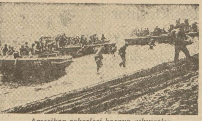
Amerikan askerleri karaya çıkıyorlar

Zamanı gelince mihver devletleri bu hücumları, aynı muharebe usullerine mukabele edeceklerdir. Bu usulleri ilk defa kullanan İngiltere okluğu için bundan doğacak mesuliyet de ona aittir.