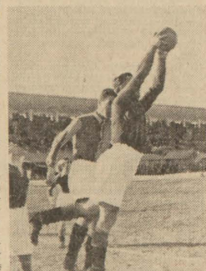
Galatasaray'ın Ankara'da İngiliz takımı ile yaptığı ve kazandığı maçtan bir görünüş : Arif hımda ...