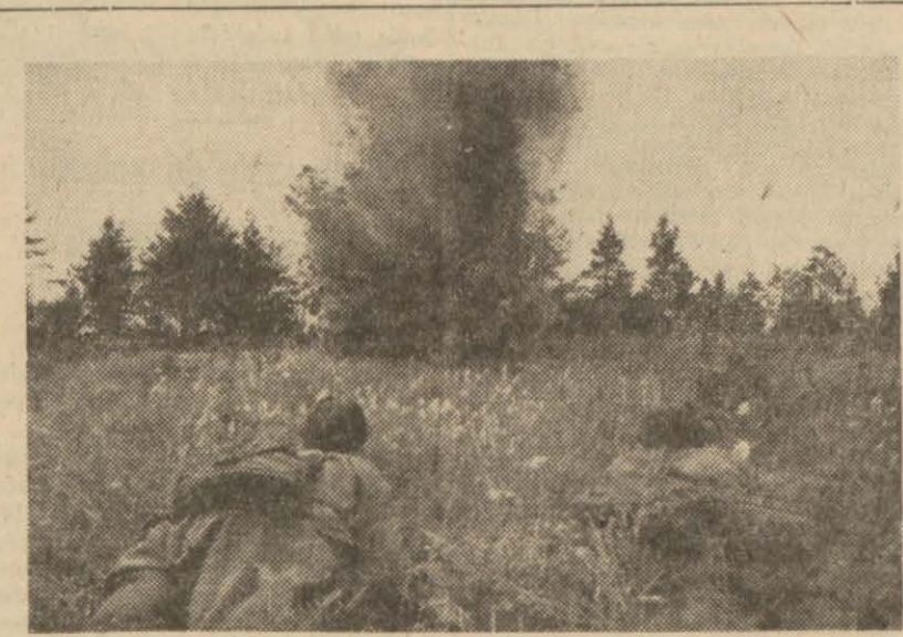
Voronej cephesinde Rus piyadeleri