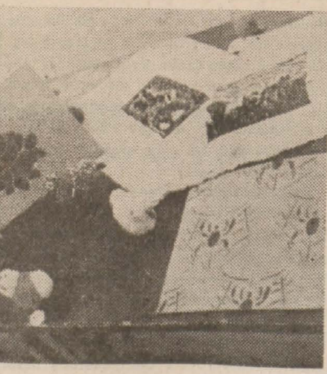
Sergiden güzel bir köşe

Bunlar kadar, bunlardan da fazla alâkayı cezbeden bir grup da renkli kâğıt parçalarını yan yana yapıtırarak yapılmış resimler. Renk tanınmaz, renge, fırçaya hâkim olabilirler, kuvvet ve cesaretle yağlı boya resim yapabilmek için bundan daha güzel, daha muvaffakiyetli bir yetiştirme usulü olamaz. Küçüklerin bizzat hazırladıkları kağıtlarla, kumaşlar üzerinde yaptıkları renkli motifler, kendi yuvalarını tezyin bakımından da çok faydalı bir çalışmadır. Bu suretle ister istemez ebeveynin alâkası da çocuğun istidatı üzerine cebeltilmiş oluyor. Sergide çocukların yaptığı pek çok tayıre modelleri var. Bunlar geniş salonu uçuşa hazırlıyorlar. Çocukların muvaffakiyetine en büyük delili, herhangi bir model tecrübe ettiginiz zaman uçabilmesidir. Bu gibi çalışmalarla çocuk serâzat değiştir. Burada ruhi fevralarına yer yotkur. Özgürlük, hesaplı, düzgün bir eser yaratmaktadır ki ancak neticeleri temin eder. Şüphesiz mekteplerimizde çocuklarımızı bu tarzda yetiştirirsek hepimiz inşirah veririz.