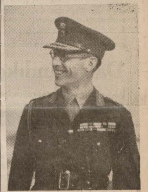
Yunan kiralı S. M. Jorj