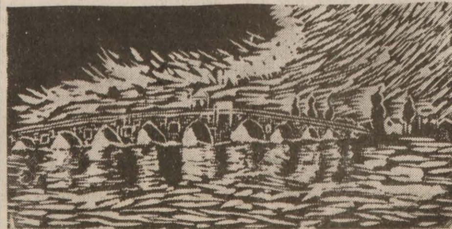
Sergide teşhir edilen gravürlerden bir tanesi

Küçükler cidden muvaffak olmuş güzel eserler verdiler