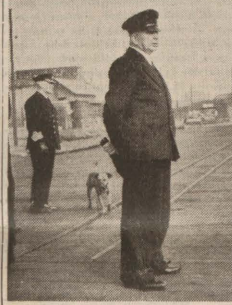
İngiltere Bahriye Nazırı B. Alexander