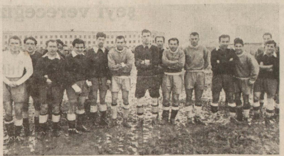
Harbiye İdman Yurdu - Demirspor takımları bir arada

Dün Ankara'da futbol birinciliği maçları son iki müsabakası yapıldı. Havanın soğuk ve sahada maçı seyretmek hayli müşkül olduğu halde, harap tribünlerle gene binlerce seyirci toplandı. Çünkü müsabakalardan, bilhassa Demirspor - Harbiye maçı, millî kümeye geçecek takımı tayin bakımından çok mühimdi.