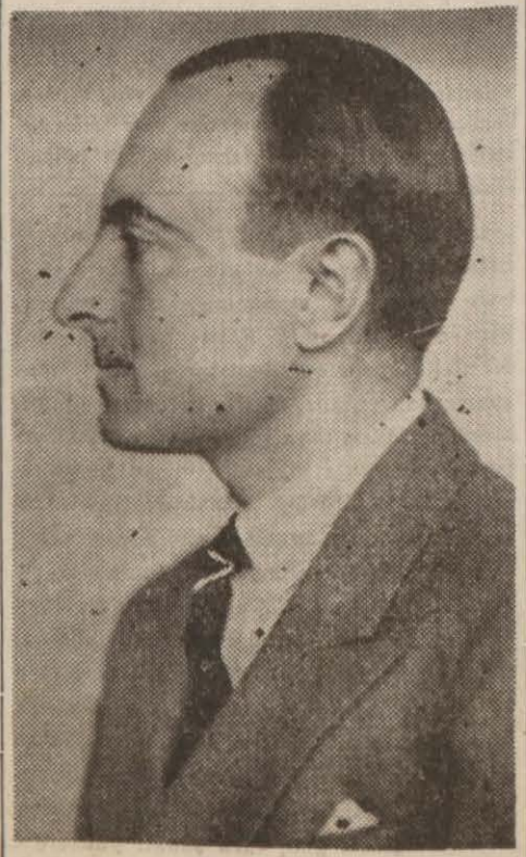
Yugoslavya Kural Naibi Prens Paul