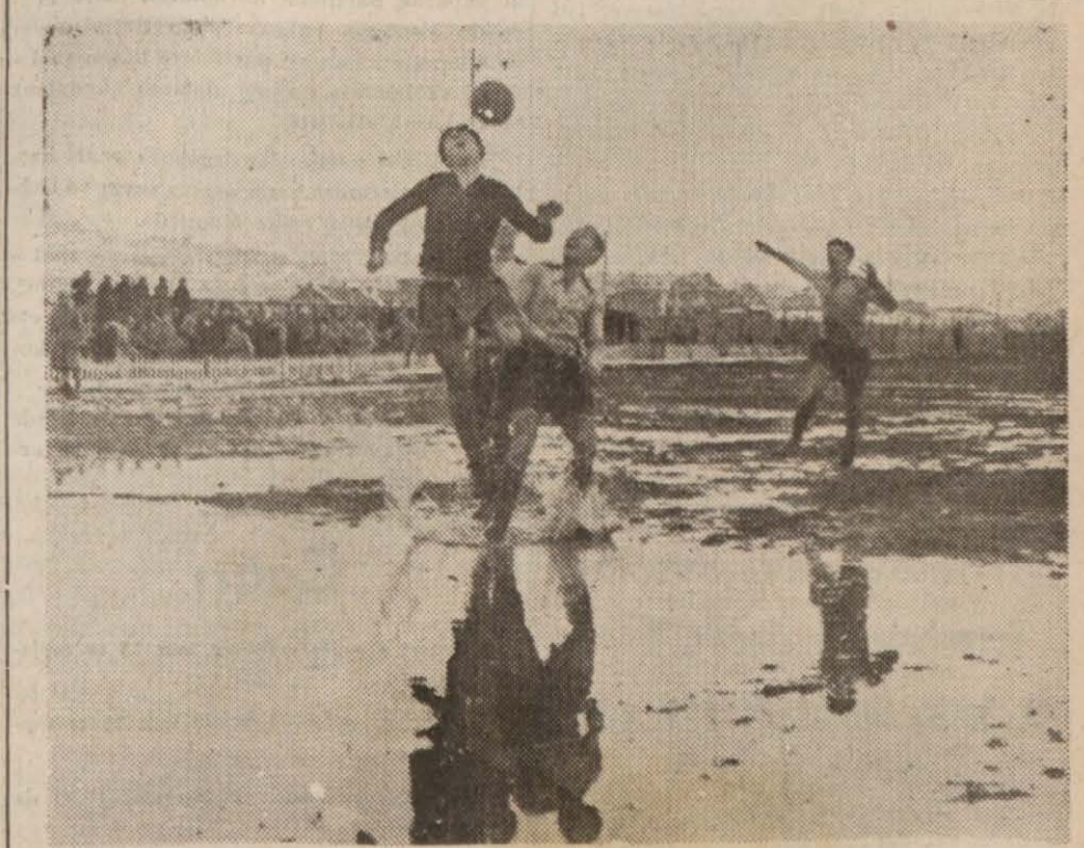
Dün İstanbul ve Ankara'da futbol maçları yapılmıştır. Yukarıdaki resim bir çamur deryası halinde olan sahada Mashespor - Kırkalkale maçı esnasında alınmıştır. Spor haberlerimiz 2 inci sayfadadır.