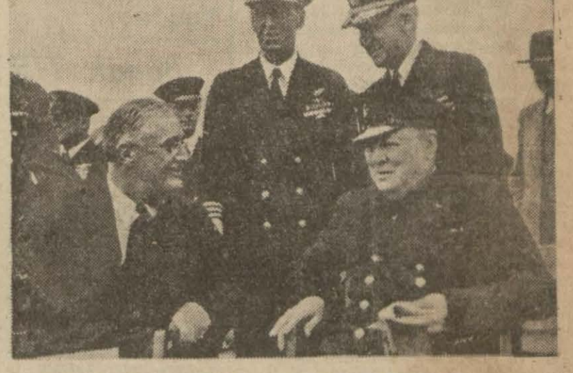
Mr. Çörçil ve Mr. Ruzvelt'in Atlantik görüşmesi sırasında alınmış bir resmi

Stokholm, 19 a.a. — D.N.B.: Londra'dan bildirildiğine göre, İngiliz hükümet merkezindeki siyasi mahfiller ve parlamento mahfillerinde M. Çörçil'in nerede bulunduğu hakkındaki merak, gittikçe artmaktadır. Üç gündüberi, başvekil, gerçekten, avam kamarasında hiç görülmemiş ve bazıları mühim olan görüşmelerin hiç birisine iştirak etmemiştir. Londra'da şu cihet belirtilmektedir ki geçen defa da M. Çörçil ortadan kaybolduğu zaman Atlantik'e açılmış ve Reis Ruzvelt ile görüşmüştü. Perşembe günü birçok mebuslar, M. Attlee'den M. Çörçil'in nerede bulunduğunu sormuşlardır. M. Attlee, bu suallere en ufak bir cevap vermemekten kaçınmış ve bu da, Londra'da dolayan sayıları daha ziyade fazlaştırmıştır. Şimdî her yerde iddia edildiğine göre, M. Çörçil İngiltere'de değildir ve yabancı memleketlerde bir yerde bulunmakta ve orada müttefik memleketlerin en yüksek devlet adamları ile çok mühim siyasi görüşmeler yapmaktadır. M. Çörçil'in bizzat iştirak ile Vaşington'da ve yahut Moskova'da toplanan bir müttefikler konferansından bahsedilmiştir. ( Sonu 3 üncü sayfada )