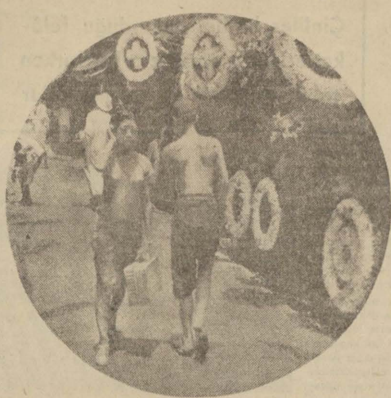
Hong - Kong'un işlek caddelerinden birinde "modern" giyinmiş bir çinli kız ve yarı çıplak bir yerli