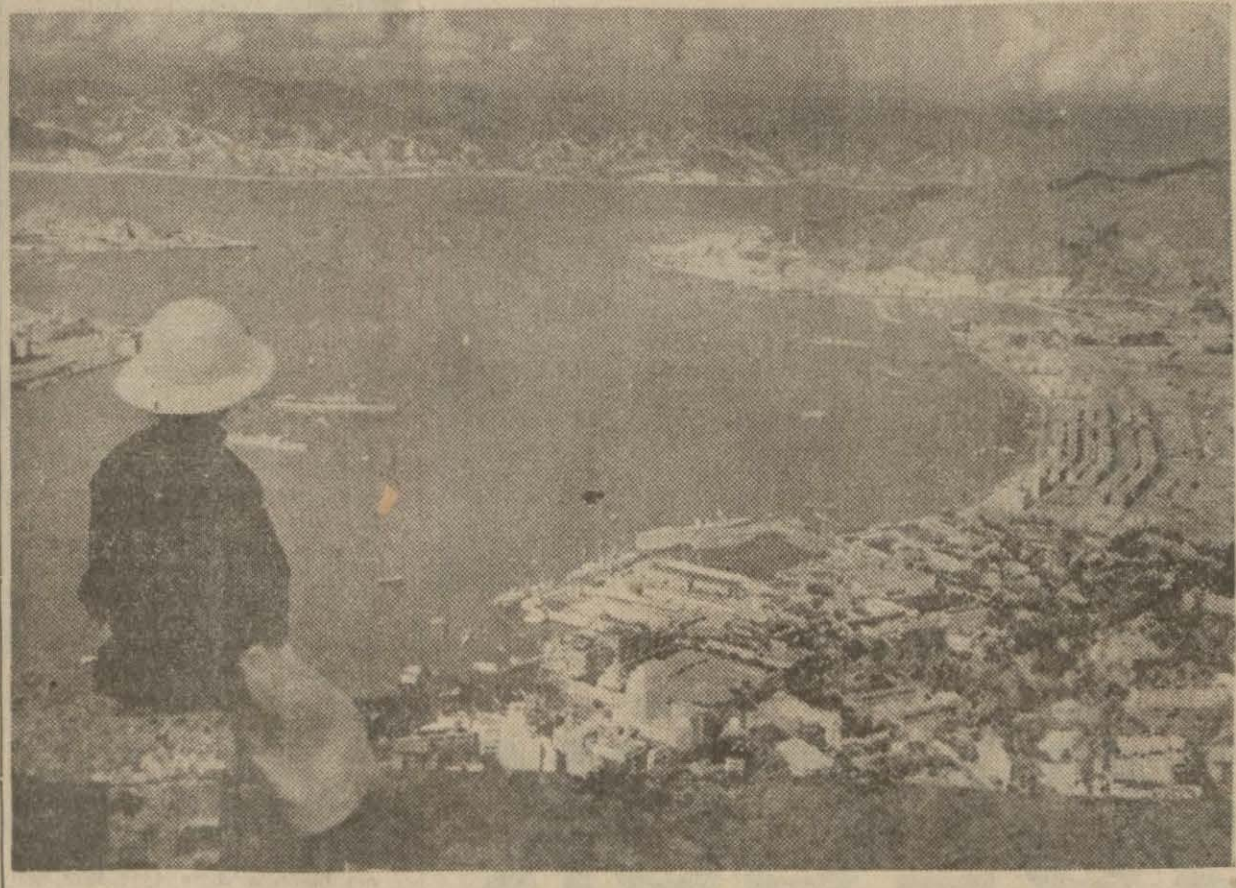
Japonların üç noktada kara ya çıktıkları Hong-Kong'un umumî görünüşü

Karşıya buluşa bütün kıtaları kan ve ateşe sürülen harp, cenup Amerika memleketleri için de nazik bir mesele ortaya çıkarmıştır. Dün gelen bir telgraf, Brezilya hükümetinin Anglo-Sakson devletleri ile Japonya arasındaki bu harpte tarafsız kalacağı hakkındaki kararın Berlin'de tehsir edilmiş olduğunu bildirmekte idi. Berlin'e göre harp dışı kalmak isteyen bu memleketlerle, onları kendi yanında hareket ettirmek isteyen Birleşik-Devletler Reisi arasında bir çarpışma vardır ve neticenin ne olacağı hakkında şimdiden hüküm vermek doğru değildir. Nitekim, Peru hükümeti, Havana ve Lima kantarlarının "öteki yarımküreden bir devlet, Amerika devletlerinden her hangi birine saldırışta bulunursa, bu hare-