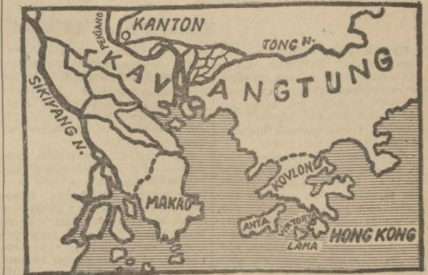
Hong - Kong ve etrafını gösterir harita