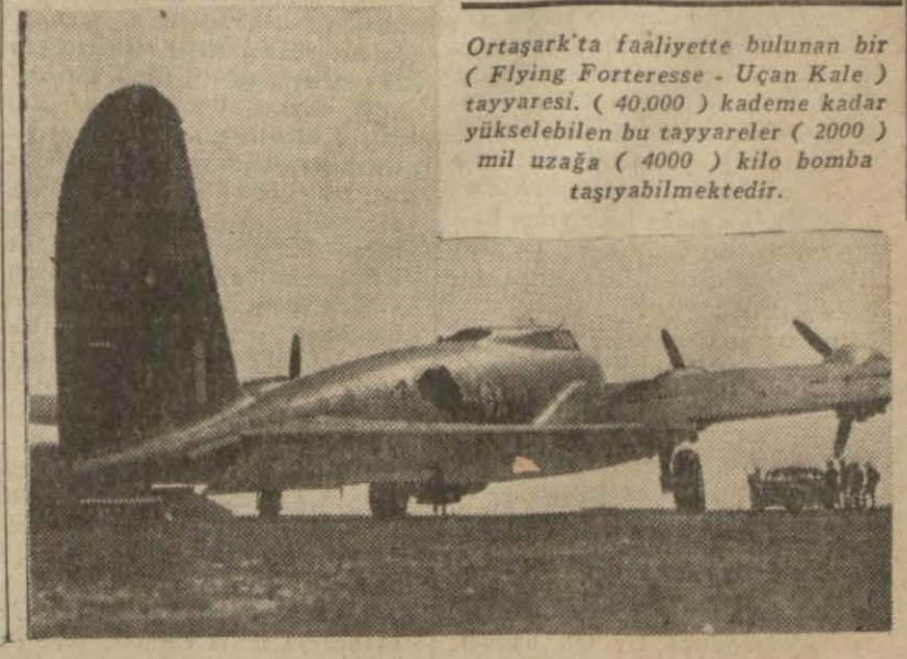
Ortaşark'ta faaliyette bulunan bir ( Flying Forteresse - Uçan Kale ) tayyaresi. ( 40.000 ) kademe kadar yükselebilen bu tayyareler ( 2000 ) mil uzağa ( 4000 ) kilo bomba taşıyabilmektedir.