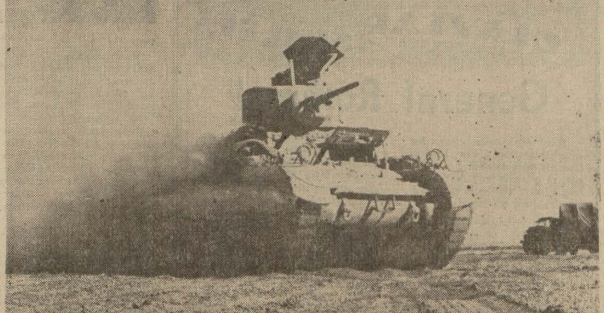
Garp gölünde bir İngiliz tankı hareket halinde

Üç sınıf üzerine tertip ettiğimiz (ULUS ESKRİM KUPASI) müsabakaları İkinci - kânunun 10 uncu cumartesi günü başlayacaktır. Bugüne kadar müsabakaya girmek üzere bize adlarını yazdırmış ve fotoğraflarını göndermiş olanların sayısı 37 dir. Evelce de yazdığımız gibi, yazılma müddeti bugün bitmiştir. Fakat müsabakalara daha yirmi gün bulunması dolayısıyla yazılma müddetini ay başına kadar uzatmaya karar verdik. İsteklilerin bu müddet içinde mektupla spor muharririmize başvurularını rica ederiz.