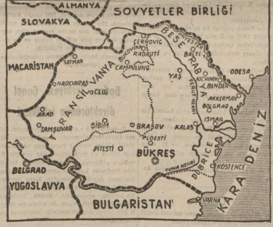
Romanya'nın umumî harpten evvelki vaziyetiyle sonraki hudutlarını Besarabya'yı, Transilvanya'yı ve Dobrice'yi gösterir harita

Rumen kabinesinin sukut etmesi muhtemel değildir, fakat düşecek dahi olsa, yeni kabinenin, demir muhafızlar arasında müteakkele veya bir askerî hükümet olacağı söylenmektedir. Bugün Romanya'da hüküm süren endişenin diğer bir sebebi de