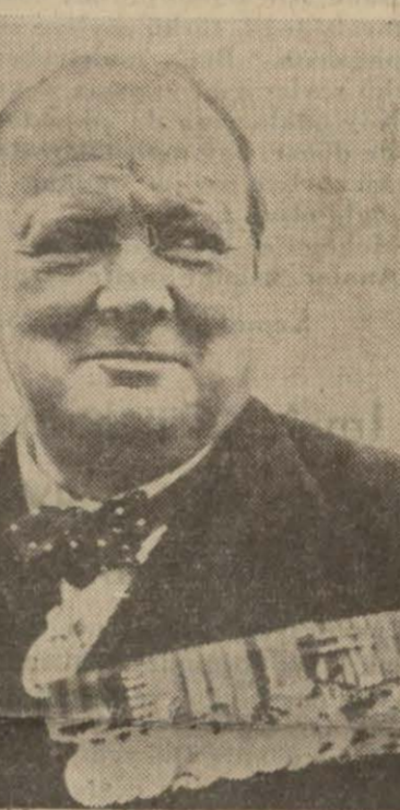
İngiliz Başvekili Çörçil'in şimdiye kadar çarpıştığı 7 cephede aldığı harp madal- yaları göğsünde olduğu halde almış bir resmi

Devlet Demiryolları umum müdürlüğü nezdinde yaptığımız tahkikat bu haberin bazı kısımlarının tashihihine lüzum göster- mektedir : 1— Evelki gündenberi hem yolcu hem de eşya nakliyatı başlamıştır. Bu suretle dolu 7 marşandiz vagonu Edirne üzerinden sev- kedilebilmiştir. 2— Yunanistana gidecekler müstesna ol- mak üzere yolcular hiçbir tahdidata tâbi değildir. Yunanistana gidenler hususî Yun- nan vizesi almak mecburiyetindedirler. 3— Bütün yolcular bagajlarını kendi yan- larında nakle mecburdurlar. Mektup nakli- yatı hiçbir tahdide tâbi değildir.