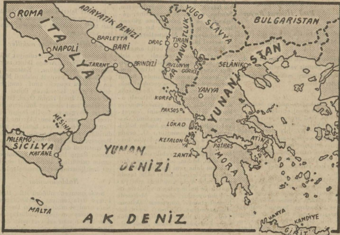
İngilizlerin ihraç yaptıkları Girid adasını, Yunanistan'ın vaziyetini ve İngiliz tayıyarelerinin bombardıman ettikleri Brendizi ve Bari şehirlerini gösterir harta

şında değil. Fakat tehlike kapımı- zı çaldığı vakit, şimdiden kolaylıkla başarabileceğimiz işlerin her biri, birdenbire, müstesna ehemiyetler alır. Bir tek parolamız vardır: ha- zır olmak! Bunun mânâsı, devletçe olduğu kadar milletçe, aile aile, fert fert, hazır ve ihtiyatlı bulun- maktır.