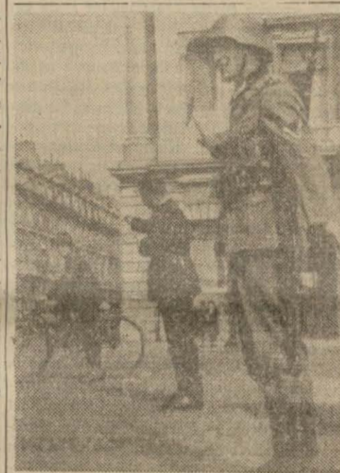
Paris'te fransız polisiyle beraber işaret memurluğu yapan alman askeri

Kızılay ilk yardım olarak Edirne'ye 2000 lira yolladı