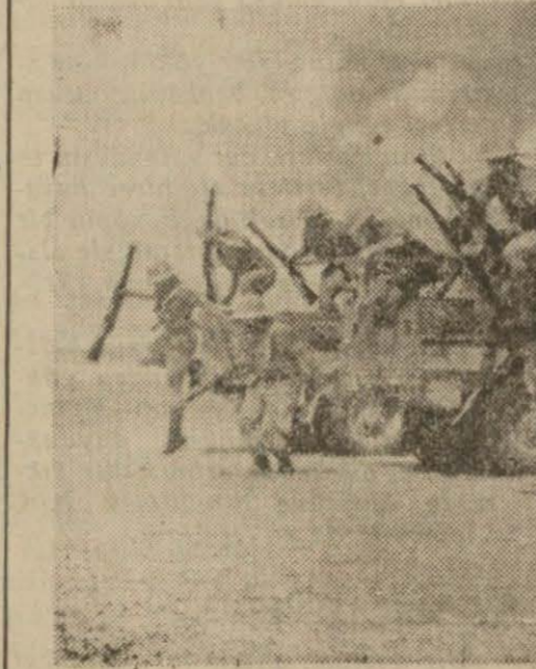
Kamyonlardan atlıyarak çölde hücum hazırlanan hür fransız askerleri