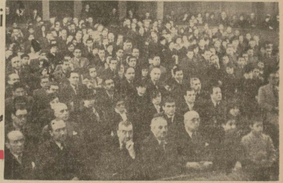
Halkevindeki toplantıda Başvekilimizin nutkunu dinleyenler

Meriç ve Tunca nehirlerinin suları inmeğe başladı