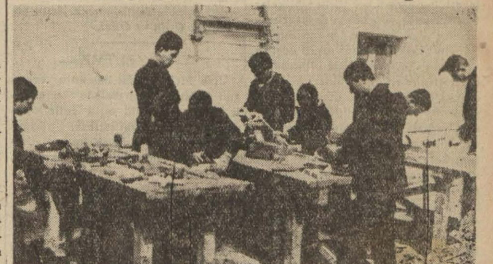
Bir köy kursunda marangoz talebeler çalışırken