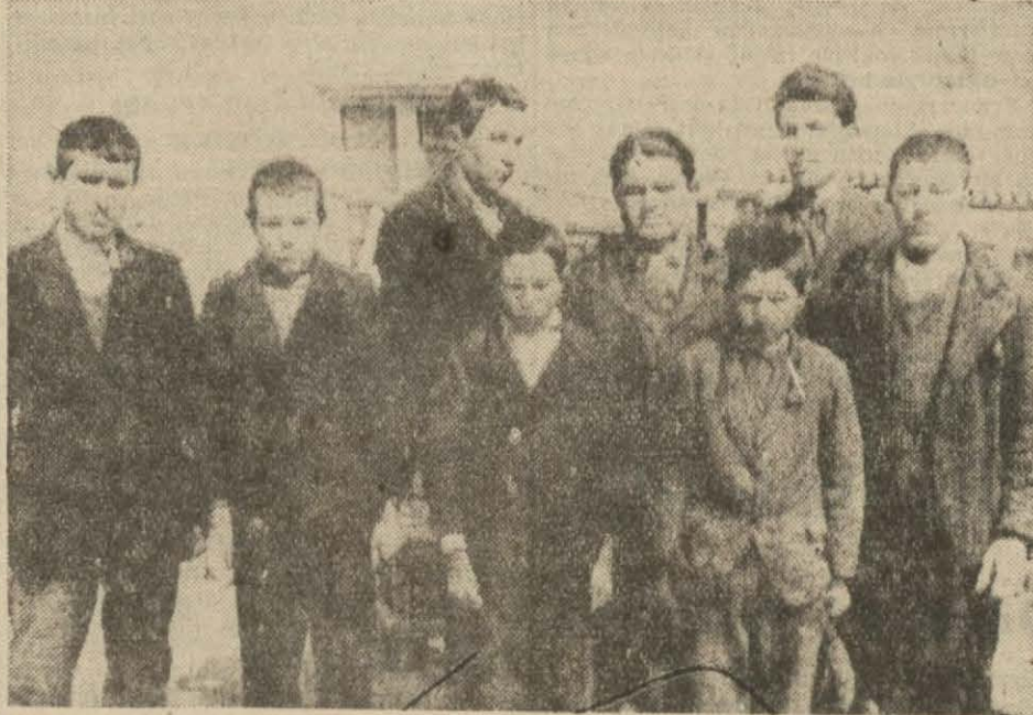
Bir köy kursunda marangoz talebeler

Birçok köylerimizin dağınık, kasaba ve şehirlerden uzak oluşu köylünün evinde ve işinde hemen daima kullanılmak mecburiyetinde bulunduğu vesaiti kolaylıkla temin edilebilmesine veya bunların tamirlerini ihtiyaç hasıl olduğu zaman hemen yaptırabilmesine engel olmaktadır.