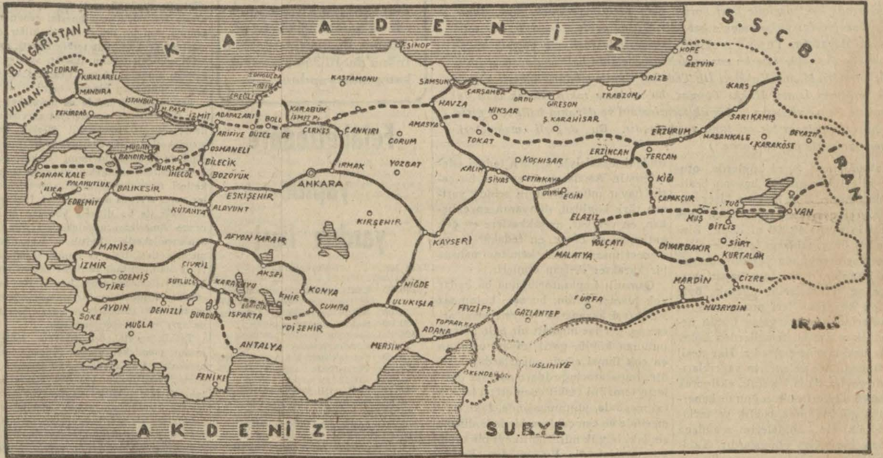
Demiryolumuz ve inşası mutasavver hatlarımızı gösterir harita