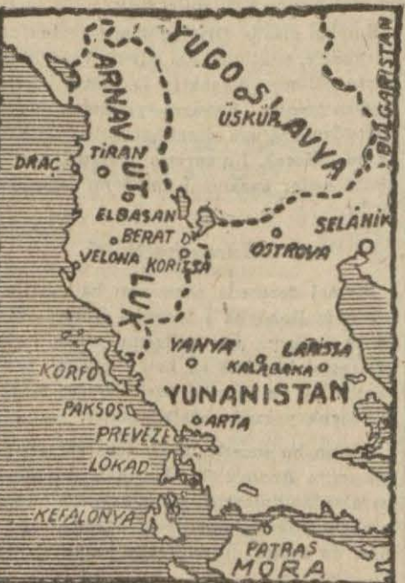
Yunanistan ve Arnavutluk vaziyetini gösterir harita (Yazısı 5 inci sayfada)

Üstelik Davut hocayı öldürüp başını kesenlerin iki arnavut olduğu tahakkuk etmiştir.