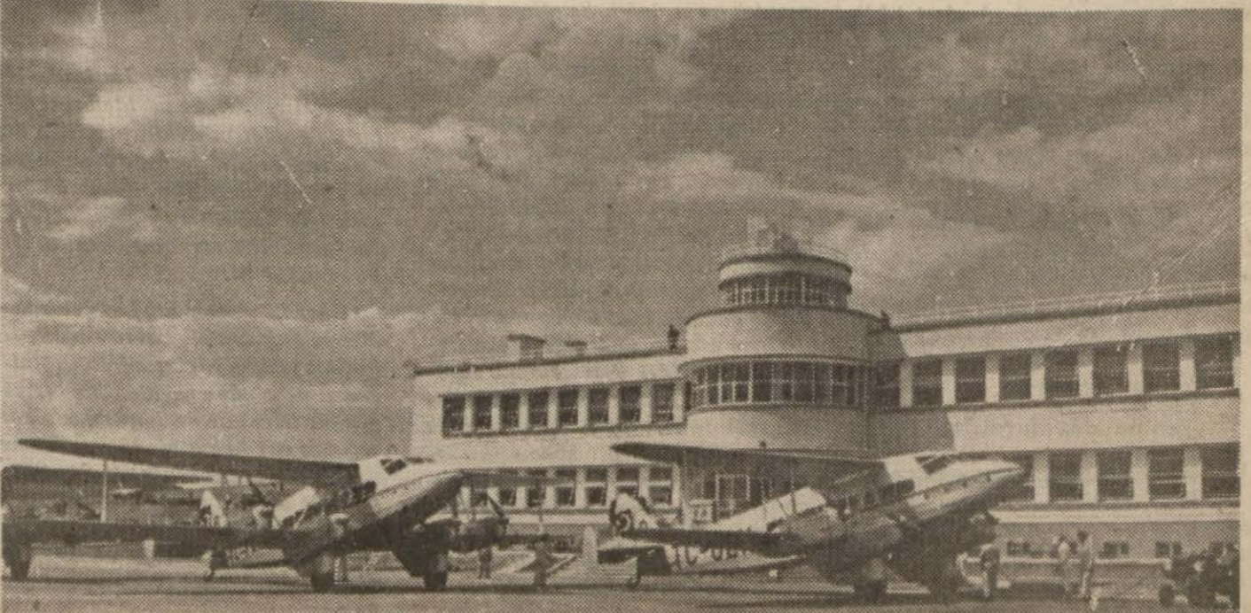
Ankara Havayolları Umum Müdürlüğü'nün Etimesut'taki yeni binası

İzmir, 8 a.a. — (Hususî muhabirimizden) — Tümgeneral Lund'un riyasetindeki İngiliz askerî heyeti bu sabah Kocatepe muhribi ile İzmir'e gelmiştir. Heyet şerefine bir ziyafet verilmiştir. İngilizler akşam üstü hareket etmişlerdir.