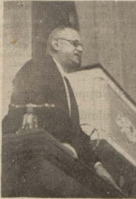
Büyük Millet Meclisi Reisi B. Abdülhalik Renda