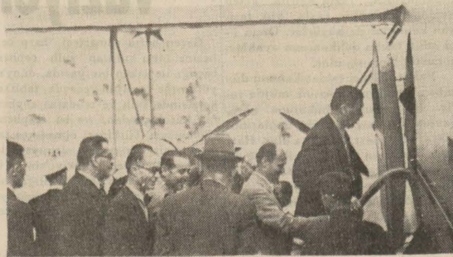
Mebuslarımız tayyareye biniyorlar

Törende Başvükilimiz bir çok Vekillerimiz mebuslar ve gazeteciler hazır bulundular