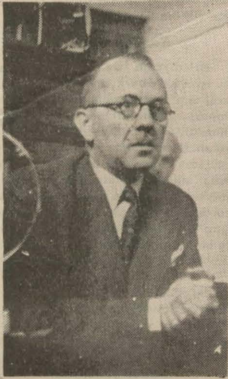
Hariciye Vekilimiz B. Şükrü Saraçoğlu beyanatını anlatıyor