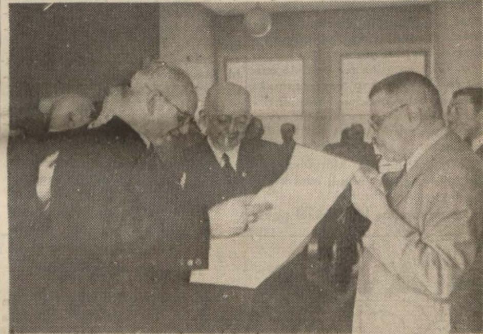
Başvekilimiz doktor Refik Saydam Havayolları hakkında Umum Müdürden izahat alıyor

Törende Başvekilimiz bir çok Vekillerimiz mebuslar ve gazeteciler hazır bulundular