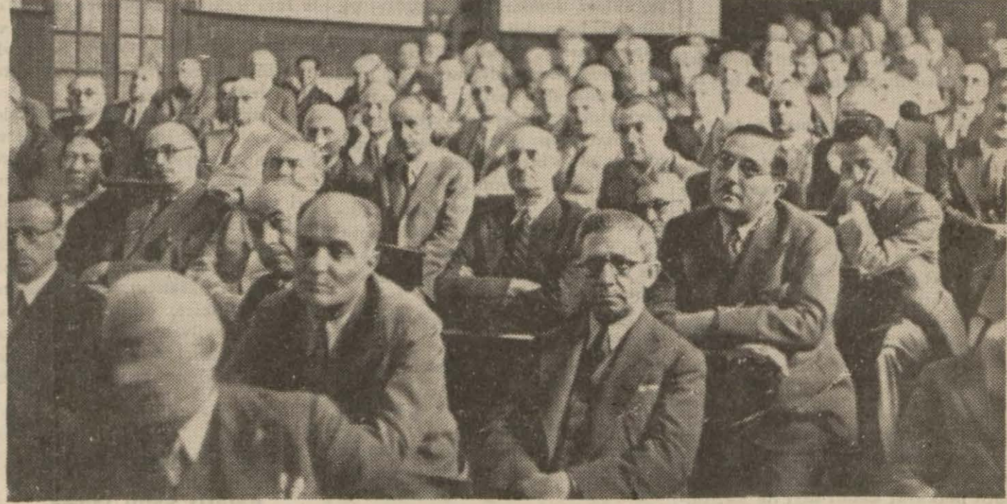
Büyük Millet Meclisi âzaları Hariciye Vekilimizin beyanatını dinliyorlar