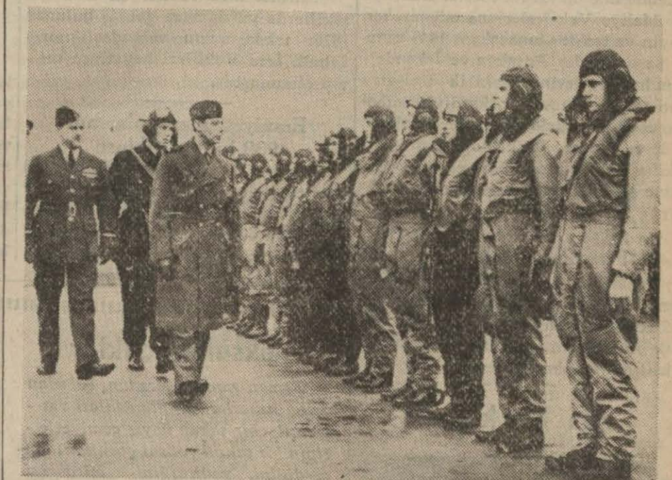
İngiliz kralı cepheye giden İngiliz tayyarecilerini tetkik ederken