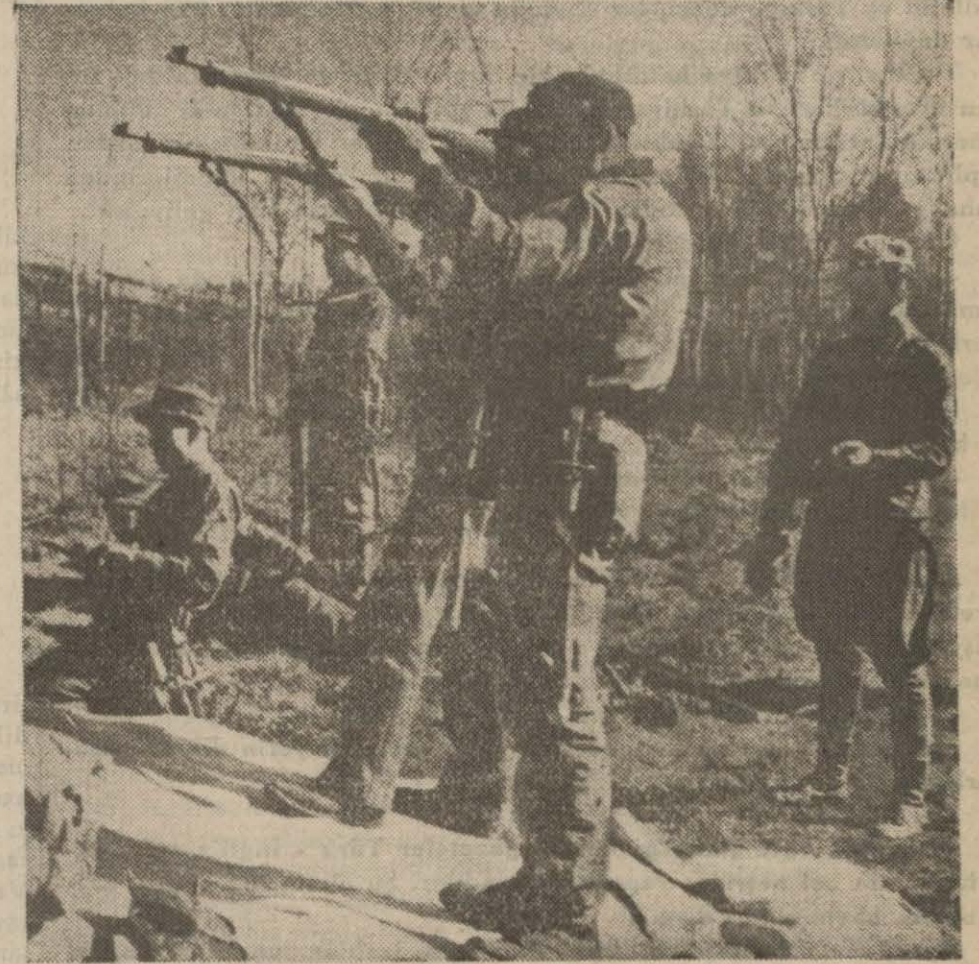
Finlandiya askerleri bir atış tâtîmi esnasında

Moskovanın bildirdiğine göre Finler dün akşam hududa tekrar tecavüz etmişler ve Sovyetler tarafından püskürtülmüşlerdir.