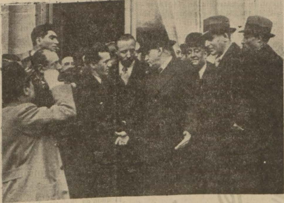
B. Daladiye gazetecilere izahat veriyor

Paris, 30 a.a. — Başvekil B. Daladiye, bu akşam Paris saatiyle saat 20 de bütün Fransız radyoları tarafından neşredilen aşağıdaki nutku söylemiştir: