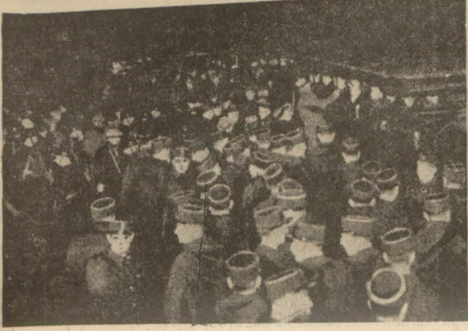
Billancourt fabrikalarının işgaline karşı sevk edilen polisler

Paris'te tahrikât yapan yüzlerce kişi tevkif edildi