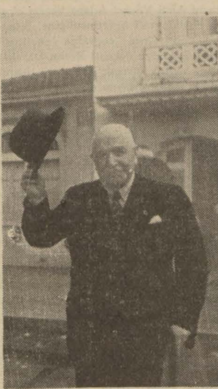
Nafia Vekilimiz B. Ali Çetinkaya

1 Kânunuevel 1938 perşembe günü Vilâyet Umumi Meclisi âzalığı için intihap yapılacağından müntehibi sanilerin o gün saat dokuzdan akşama kadar belediye salonuna gelmeleri rica olunur.