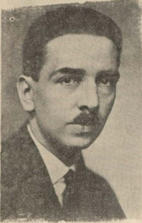
Türk Heyeti Başkanı B. Numan Rifat Menemencioğlu