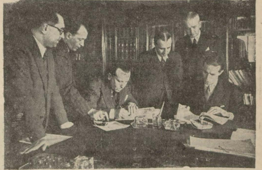
Hariciye Vekâletinde Türk - Felemenk kliring anlaşması ve mali protokol imza edilirken