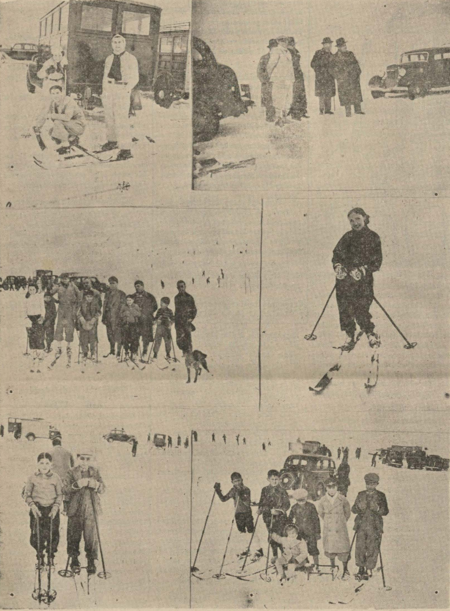
Dikmen sırtlarında dünkü canlı kış sporları gününe aid enstanteneler