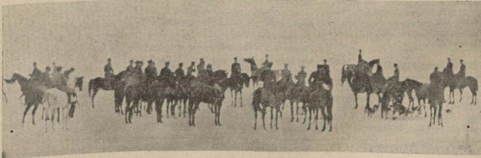
Muhafız Gücünün dünkü av binişi karlı havada çok güzel geçti