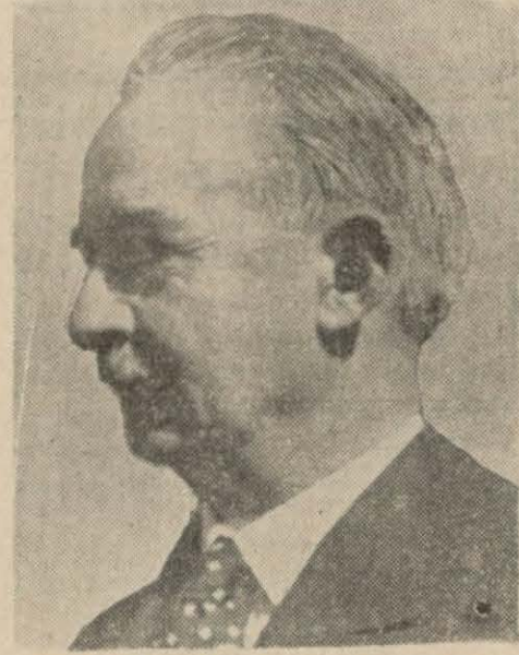
Bugün İstanbul'dan hareket edecek olan Başbakanımız İsmet İnönü

ralı rahatsızlığı yüzünden ancak üç dört gün sonra Ankara'ya hareket edebilecektir.