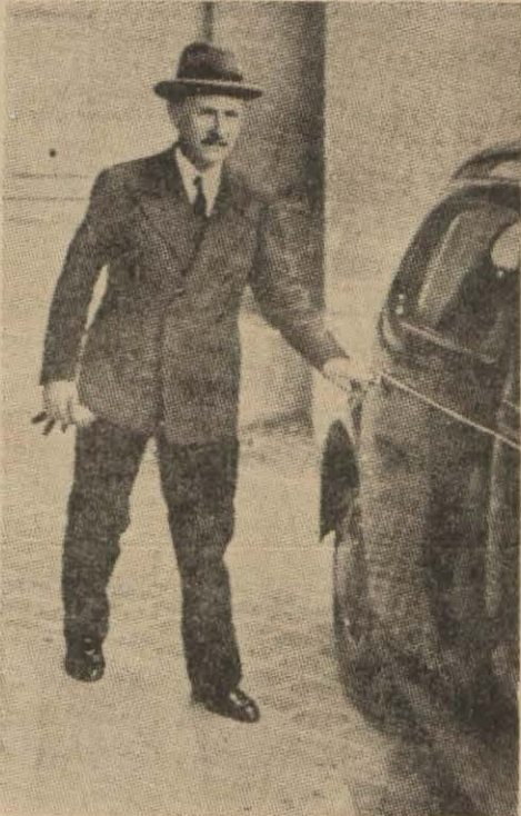
Başbakan B. Şotan fransız dış bakanlık binasından çıkarken

Paris, 29 (A.A.) — Parlamento bugün saat 15 de toplanmıştır. Başbakan Şotan hükümetin beyannamesini okumuş ve bu beyannamenin mukaddimesi sol cenahın sürekli alkışlarıyla karşılanmıştır.