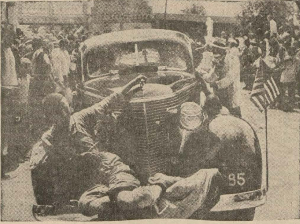
Şanghay sokaklarında yaralananlar naklolunurken