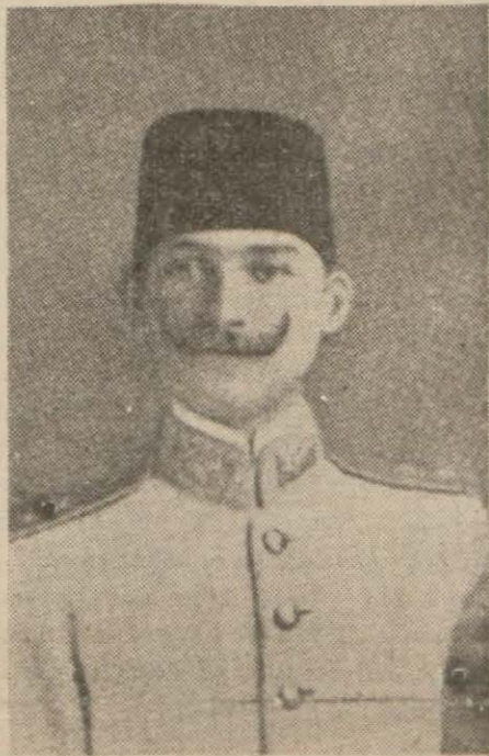
Atatürk şamda, Vatan ve Hürriyet Partisini kurduğu zaman