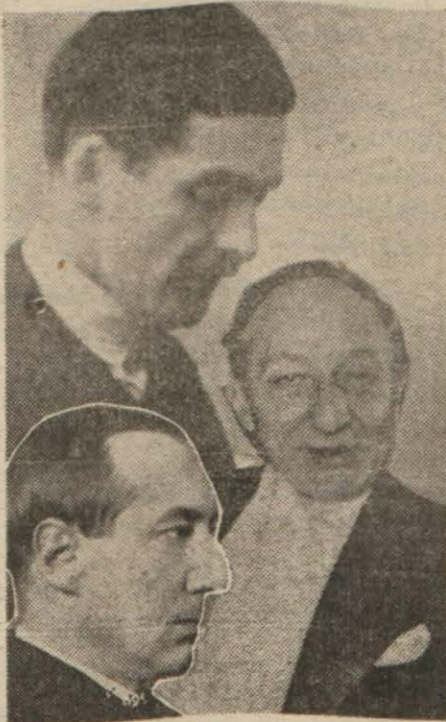
Akdeniz konferansına iştirak için Paris'ten hep beraber gelen İngiliz dış bakanı B. Eden, Polonya dış bakanı B. Bek ve Fransız dış bakanı B. Delbos

Paris, 9 (Hususi) — Almanya ve İtalya, Akdeniz konferansa davet için Fransız - İngiliz hükümetleri tarafından yapılan davete cevaplarını vermişlerdir. Bu iki hükümet, Akdenizdeki korsanlık vakalarının karışmazlık komitesi tarafından gözden geçirilmesi daha doğru olacağını ileri sürerek, Akdeniz konferansı teşebbüsünü iyi karşılamış olmakla beraber bu konferansa iştirak etmeyeceklerini bildirmektedirler.