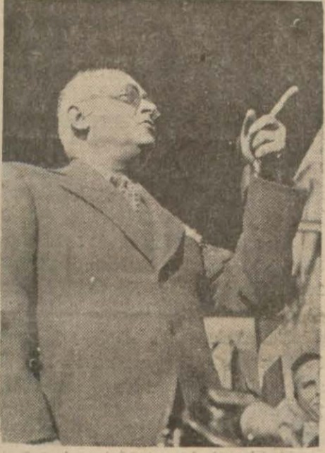
B. Celâl Bayar nutuk söylerken

Kasaba baştan başa bayraklarla süslenmişti. Bütün nakil vasıtaları yakın vilâyetlerden, kazalardan biribiri ardınca bugün yapılacak basma fabrikası açılma törenini görmek için gelen halk kitlelerini taşımaktadır.