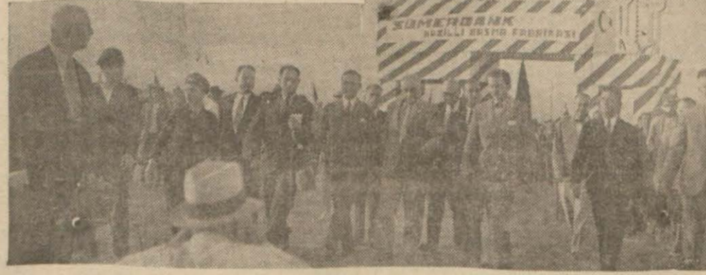
Nazilli fabrikasının ilk temeli atıldığı gün yapılan tören