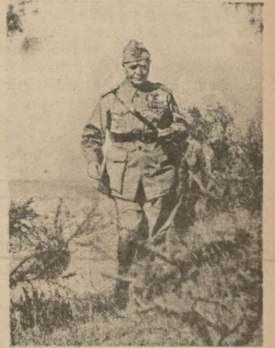
Vaziyeti iyi gören Mareşal Badoğliyo

Mareşal Badoğliyo geçen pazar günü, umumî karargâhtaki gazetecileri kabul ederek, Ras Kassa ile Ras (Sonu 3. üncü sayfada)