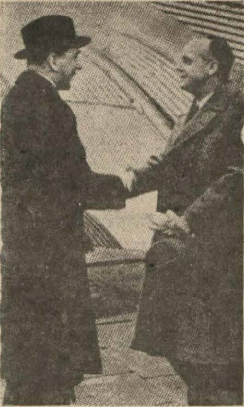
B. Fon Ribbentrop tayyare istasyonunda B. Fon Höş'le konuşuyor

6. - Üçüncü maddenin tatbikine nezaret edecek komisyon İngiliz ve İtalyan ataşemillerleri vasıtasıyla askeri vaziyetteki değişiklikleri gözden geçirebilecektir.