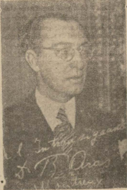
Dış Bakanımızın, Entransijan gazetesine verdiği imzalı resim

"Biz revizyoncu değiliz. Bundan bahsedildiğini işitmek bile istemem."