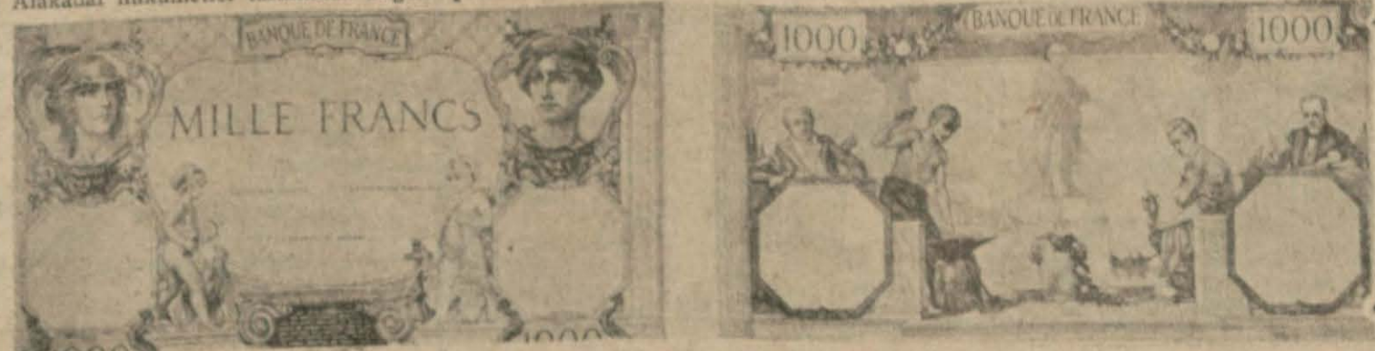
Bin fransız frangının iki taraftan görünüşü