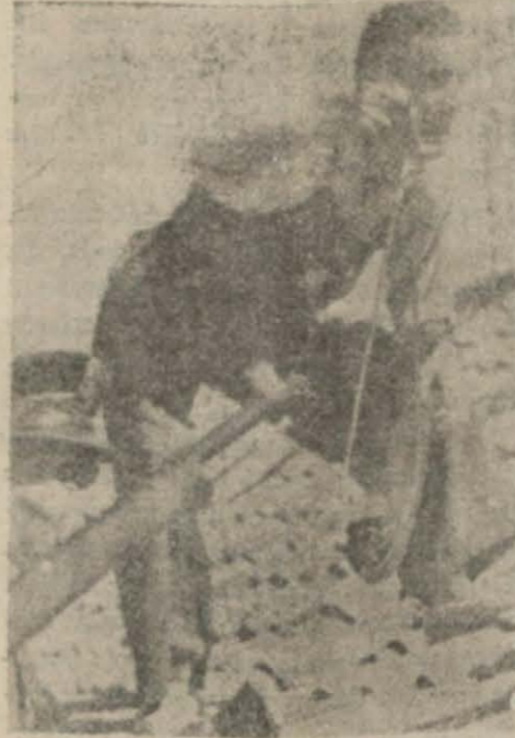
Alkazara dinamit atan bir milis

Alkazar harabelerinde hâlâ çarpışmalar olmaktadır. Nasyonalistler Bilbao yolu üzerindeki ilk hükümet mevziini aldılar