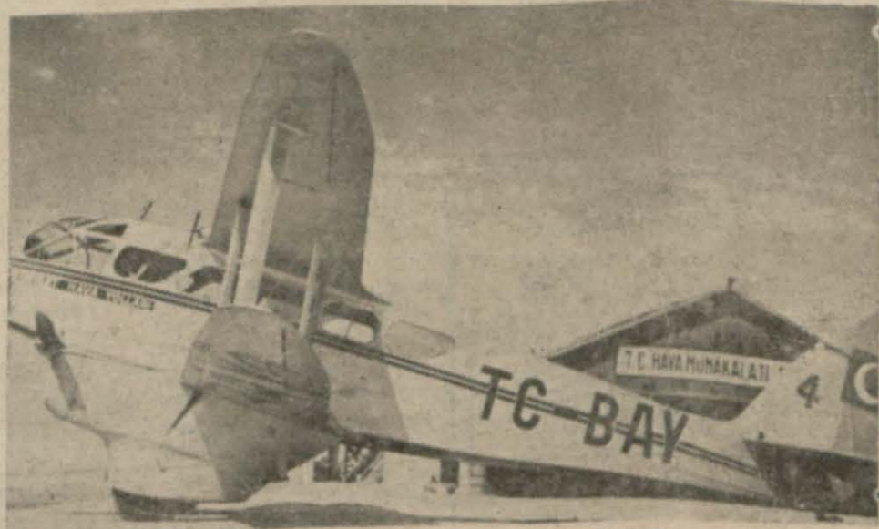
Tayyarelerimizden biri idare hangarının önünde

25 mayıstan 31 ağustos 1936 tarihine kadar yapılan sefer adedi 230, taşınan yolcu mikdarı 698, şehir tenezzüh (Sonu 3. üncü sayfada)