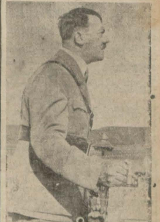
Nürnbergdeki nutku etrafında tefsiller hâlâ devam eden B. Hitler