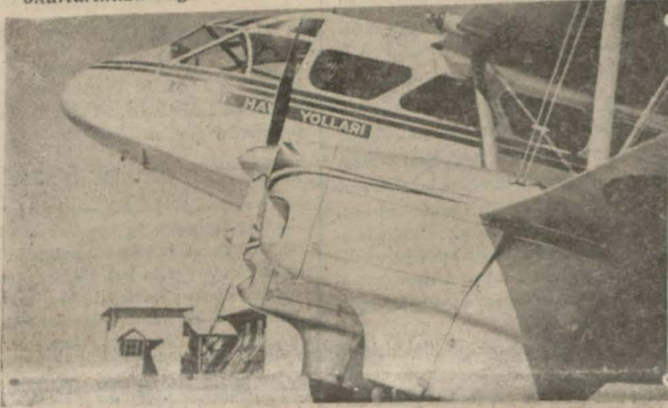
Devlet hava yolları tayyarelerinden birinin baş taraftan görünüşü

Aşağıdaki satırlar, bu sahada gösterilen başarılar hakkında okurlarımıza değerli ve faydalı bilgiler verecektir: