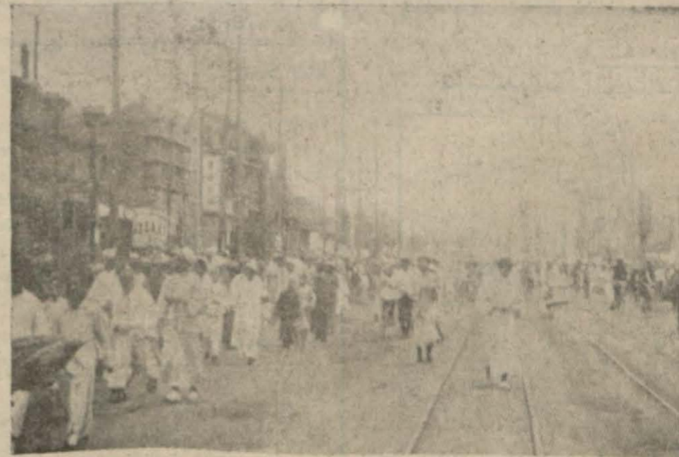
15 kilometre ilerisinde harb olan Pekinden bir görünüş

Pekin, 19 (A.A.) — Röyter bildiriyor: Pekinden 15 kilometre ileride bulunan Fengtai istasyonunda Çin ve japon kuvvetleri çarpışmaya başlamışlardır. Tafsilât yoktur.