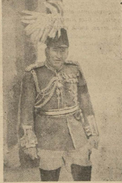
Mareşal Siril Deveril

Londra, 15 (A.A.) — İngiliz kurmay reisi Sir Siril Deveril Şefilde söylediği bir nutukta büyük bir devletin sulhu idame etmek için kuvvetli olması