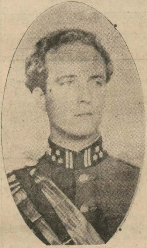
Kıral Leopold III

Kıral diyor ki: «Bir taraflı her siyaset, Belçikanın dış vaziyetini zayıflatır. Bir ittifak da bizi hedefe götürmez. Çünkü bir müttefikin yardımı, ancak müstevlinin ilk darbesinden sonra yetişebilir. Binaenaleyh münhasıran ve tamamen bir Belçika siyaseti gütmeliyiz.»