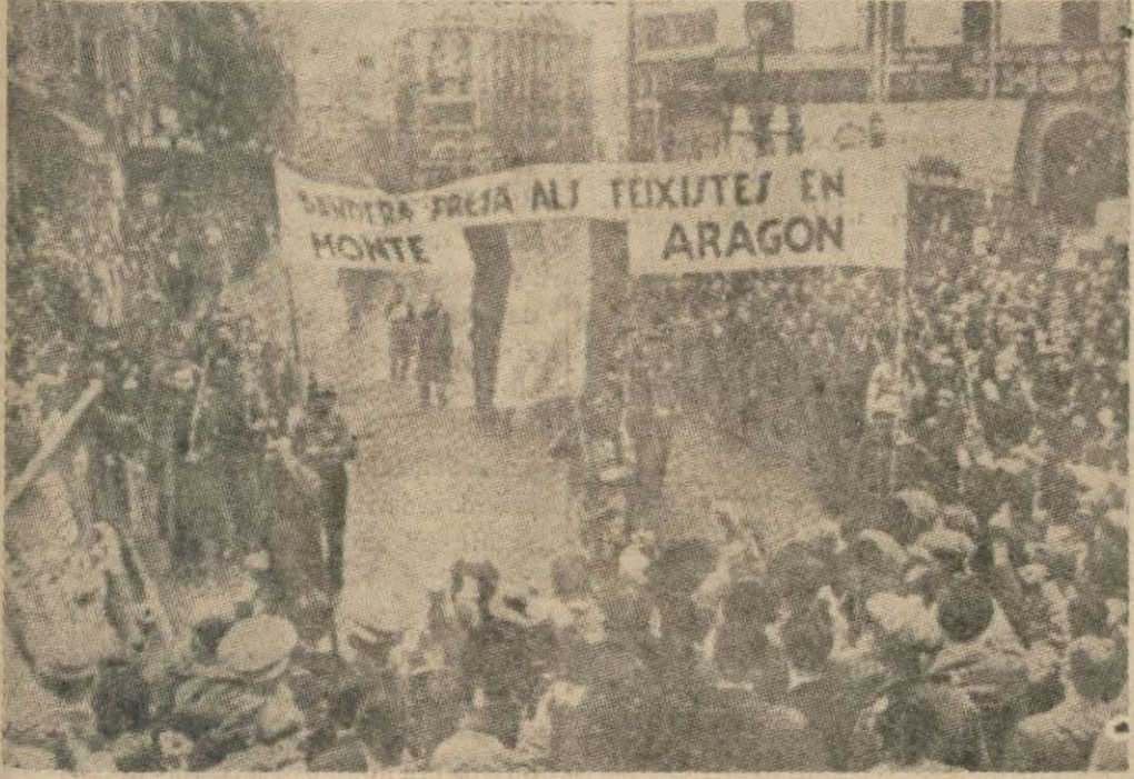
İspanyadaki kanlı ihtilâl devam ederken, 6 ilk teşrinde Barselonda Katalonya ihtilâlinin yıldönümü kutlandı

Üç sovyet gemisi Bilbao'ya gitmiş Hâdiseler çıkmasından korkuluyor