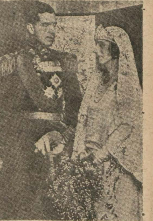
İsveç veliahdı ve zevcesi

Stokholm, 15 (A.A.) — Veliahd ve zevcesi Fransa ve Almanya içinde bir otomobil gezisi yapmak üzere yola çıkmışlardır. İkinciteğrin başlangıcında tren ve zevcesi uzun müddet kalmak üzere Londraya hareket edecektir.