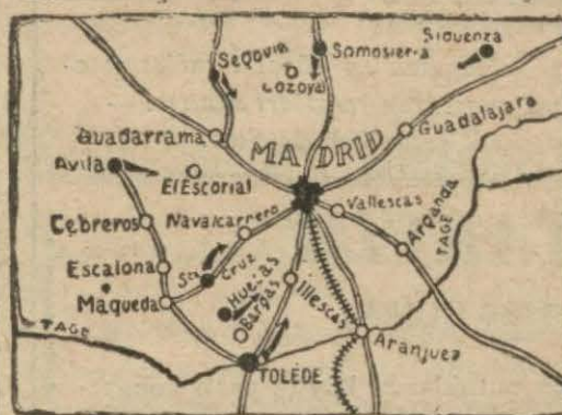
İhtilâlcilerin Madrid üzerine ilerleyişinin istikametini gösterir harta

Sevil, 15 (A.A.) — General Kueipo dö Lano dün akşam Sevil radyosunda Bilbao'nun zabtının muhakkak olduğunu bildirmiştir. Bu mevkiin çevrilmesi tamamlanmıştır. Marksistlerin Gırataya