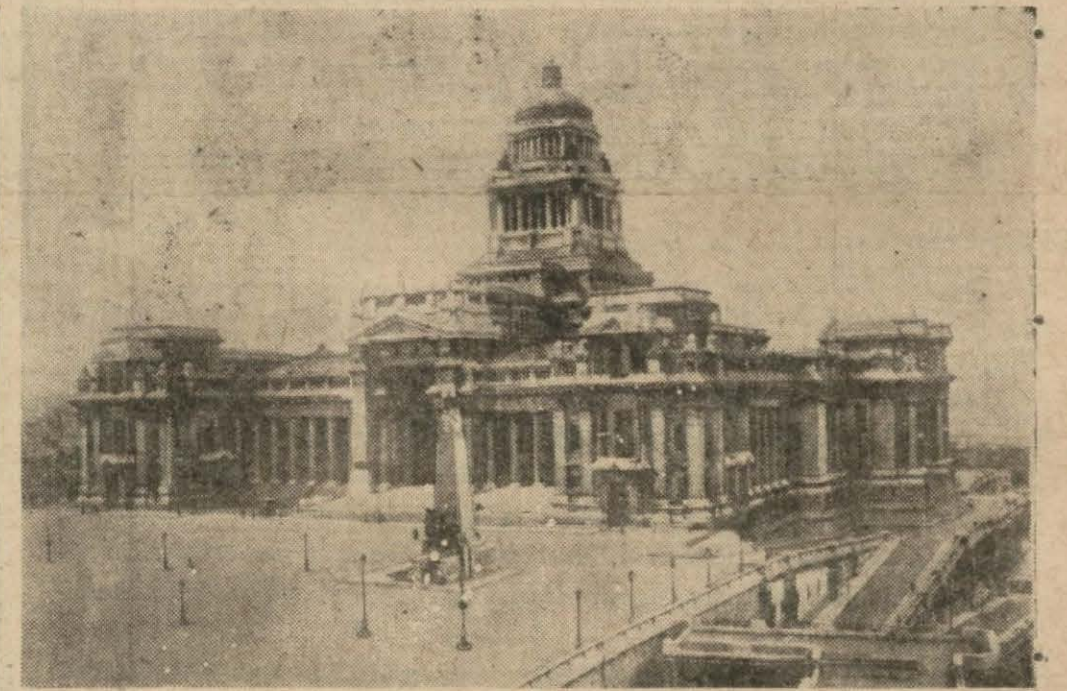
Belçikanın merkezi olan Brüksel şehrinde adliye sarayı ve piyade âbidesi

Vaşington, 15 (A.A.) — Henri Ford cumur reisi seçiminde cumuriyetçilerin namzedi Landon'u il-tizam etmekte olduğunu bugün resmen ilân etmiştir. Henri Ford, Landon'la yaptığı bir konuş-