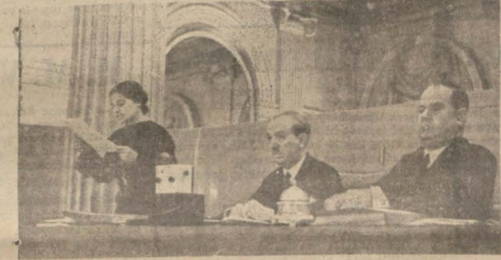
Kurultayda bir gün önceki zabıt okunuyor

rin başında bir grup unsuru vaziyetinde gördüğümüz "s" konsönunun türkçe ile yapılacak mukayeselerde muadeli bozacak bir unsur olmadığı anlaşılmaktadır. Bu konsönun türkçede ortadan çıkarıldığı halde grek dilinde inkişafa uğramış orijinal bir ses olması hatıra gelir. Teori, bu ihtimali kuvvetlendirmekten geri kalmıyor, Misaller üzerinde yapılan analiz ile müsbet neticeler gösterilmiştir. İki dilde karşılaşılan kelimelerin gösterdiği fonetik farklar, Güneş - Dil teorisinin mantığına arz edilince hakikî kıymet ve delâletleri anlaşılır ve gördükleri gibi ayrırcı değil, birleştirici birer vasif oldukları meydana çıkar..