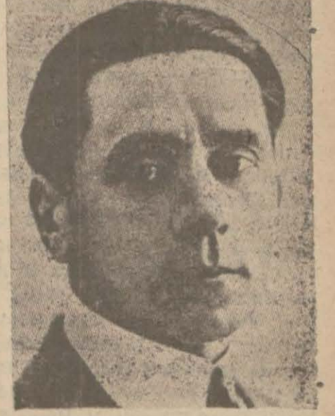
Romen Başbakanı B. Tatarsko sükünün hiç bir zaman bozulması ihtimali bulunmadığını katıyete ifade etmektedirler.

Bükreş, 28 (A.A.) — Bu sabahki gazeteler, Tatarsko hükümetinin neticesi, istifaya kadar varabilmesi muhtemel ciddi güçlükler karşısında bulunduğunu bildirmektedir. Söylendiğine göre, sağ cenah radikal partilerinin tezahürleri neticesindeki siyasal mücadelelerin önüne geçmek için alınacak tedbirler hakkında kabine azasının fikirleri arasında mahsüs farklar vardır. Halen mezun bulunan bakanlar, Bükreş'e çağırılmışlardır. Dün Sinaya'da kıral tarafından kabul olunan başbakan B. Tatarsko, yanında herb bakanı bulunduğu halde liberal parti başkanı B. Bratianu'nun halen bulunduğu Köstenceye hareket etmiştir. Bakanlar, yarın bir toplantı yapacaklardır. Bu toplantının, kabinenin devam veya ademi devamı hakkında katî netice vereceği sanılmaktadır. Maama-fih diğer taraftan hükümet mahfilleri, kabinenin vaziyete hâkim olduğunu ve