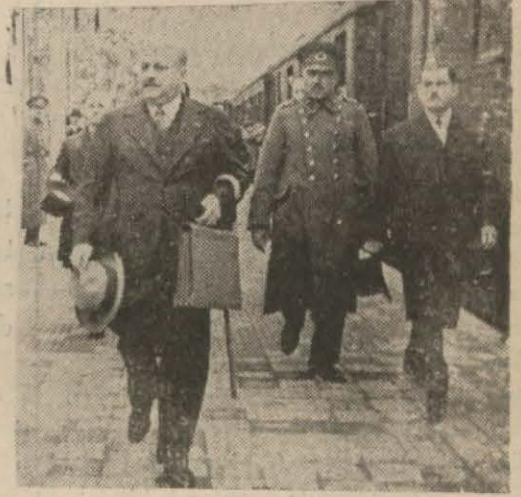
Misafirimiz Ankara durağında