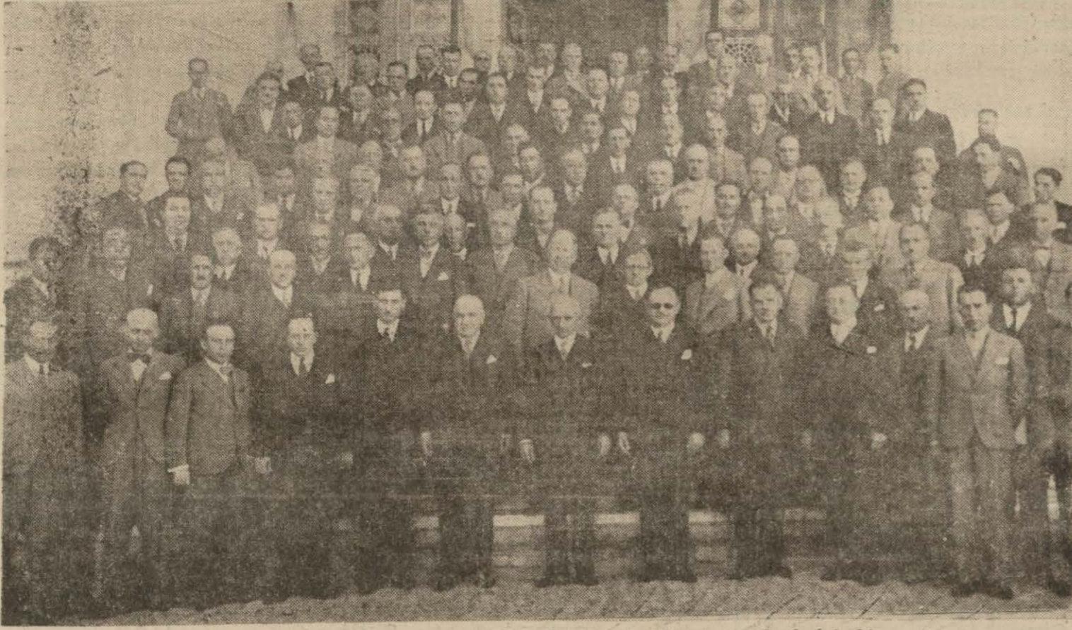
Kurultay Başkanı, Başbakanımız ve Bakanlar Uraylar Kurultayı üyeleriyle bir arada

"Düzenli işleyen her belediye, memleketimizin ilerlemesi ve yükselmesi için mühim bir mekanizmadır," — İsmet İnönü