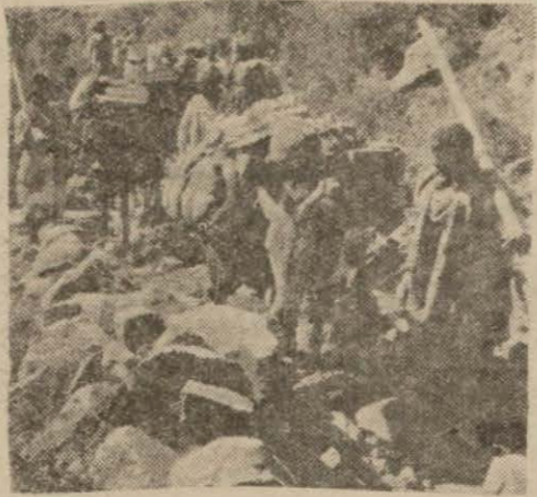
Habesler dağlarda cephaneye taşıyorlar