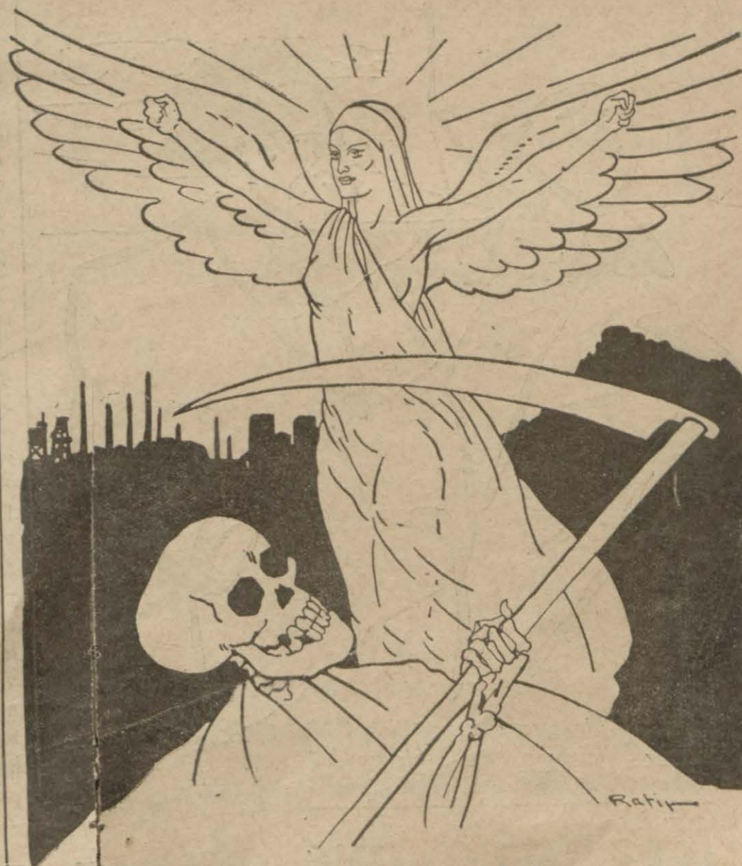
Kızılay, Yurdla ölüm ve sefaletin arasında kanat gerer

3 - Kelimenin etimolojik kuruluşu içindeki başka parçaların hangileri, mananın akışına göre, kök manasında, hangileri ek manasındadır ve her iki hale Sonu 2 sayıfada