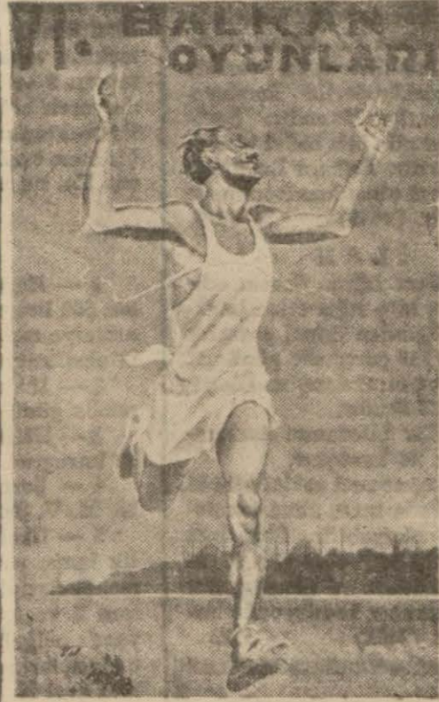
İstanbulda yapılacak Balkan oyunları için hazırlanan dört renkli kart - postal örneği

21, 22, 29 Eylül 935 tarihinde İstanbulda yapılacak balkan oyunlarının programı sırasile aşağıya yazılmıştır