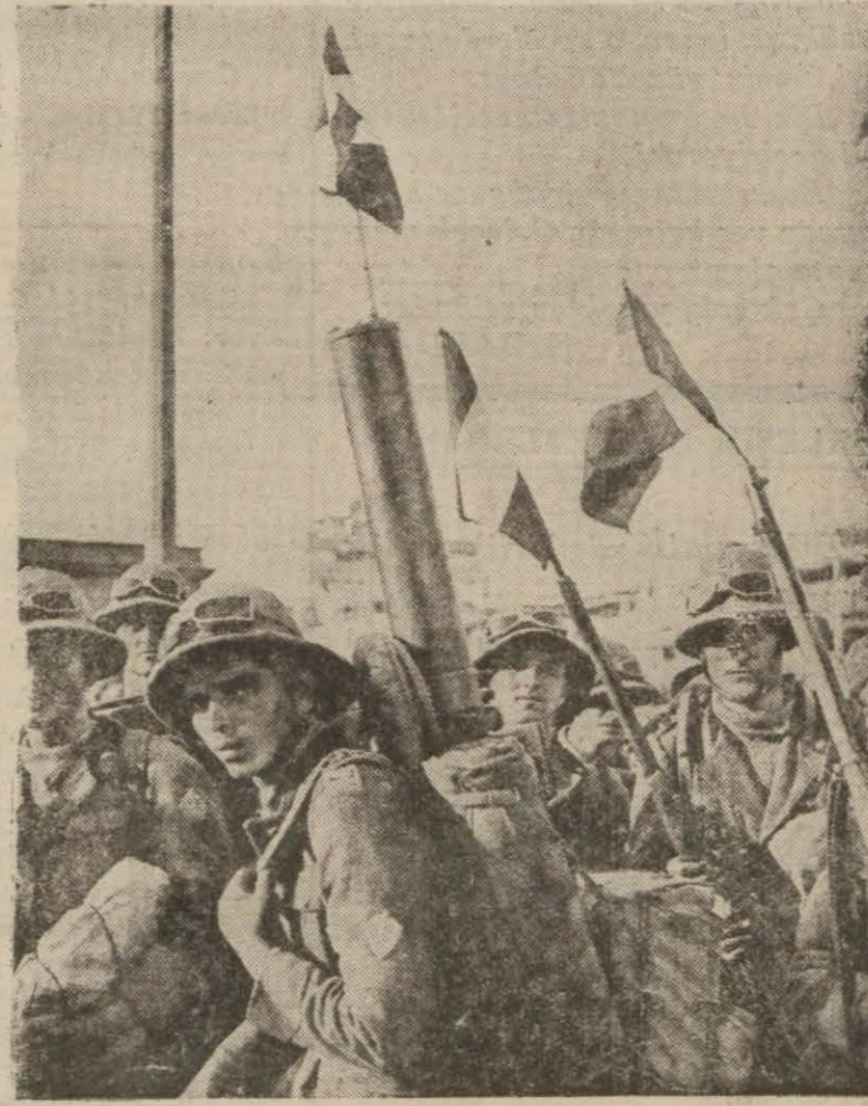
İtalyan askerleri Napoliden Atrikaya hareket ederken.

fransız başbakanı B. Laval Fransanın barışçıl bir anlaşma elde edil