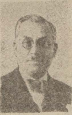
B. Celâl Bayar