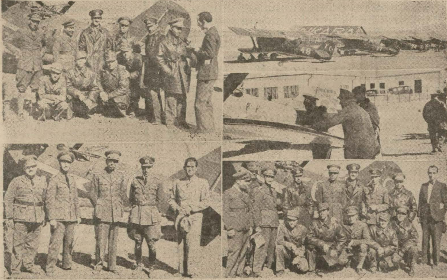
Dün Türkiye turunu başarı ile bitiren yerlerini dönen uçaklar, uçmanlarımız, yargıç kurulu.

Uçmanlarımız fırtınalı ve bozuk bir havada uçuşlarına hiç ara vermeden yurdu dolaşmışlardır. Türk ulusu havasının egemenliğini koruyan yiğit subaylarımızı her yerde sevgi ve gururla bağrına basmıştır