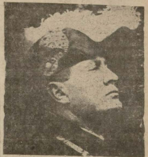
Uruşur sosyetesinden çıkmak imkânlarını araştırarak İtalya bakanlar kurulu başkanı B. Musolini

Sofya, 14 (A.A.) — Polis direktörlüğü bildiriyor: Bir zaman danberi bulgar polisinin elinde bir Makedonya komünist örgütünün var olduğuna ve bu örgütün gizli çalıştığına dair bir takım bel- (Sonu 2. inci sayıfada)